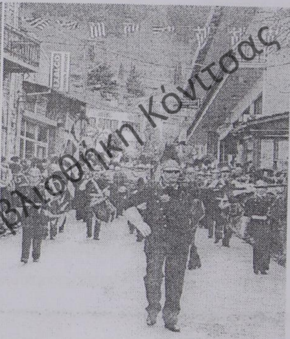
Παρέλαση στην Κόνιτσα 25 Μαρτίου 2006