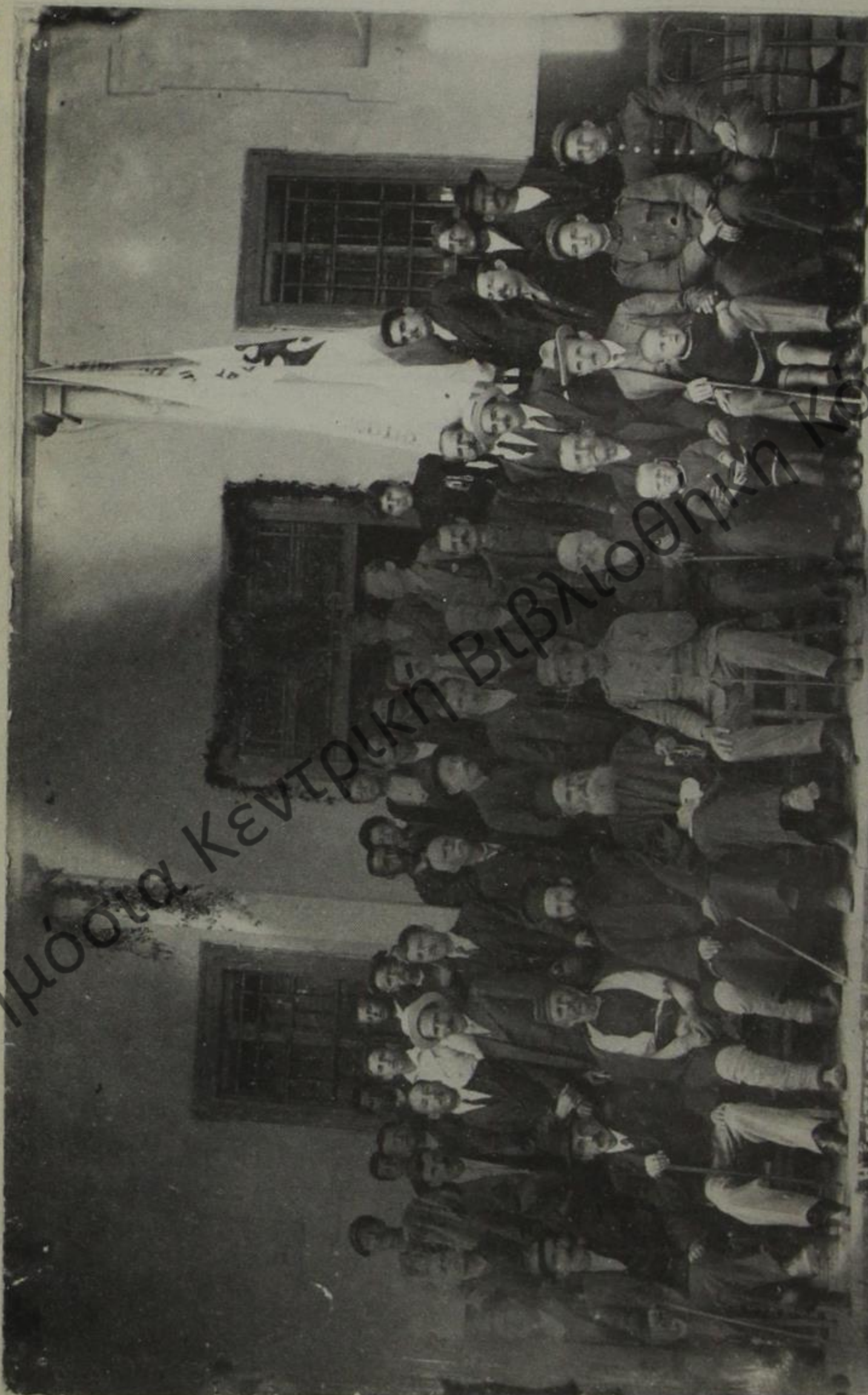
Η ΕΠΕΤΕΙΟΣ ΤΟΥ ΚΟΙΝΟΤΙΚΟΥ ΣΥΝΔΕΣΜΟΥ 30-6-1922