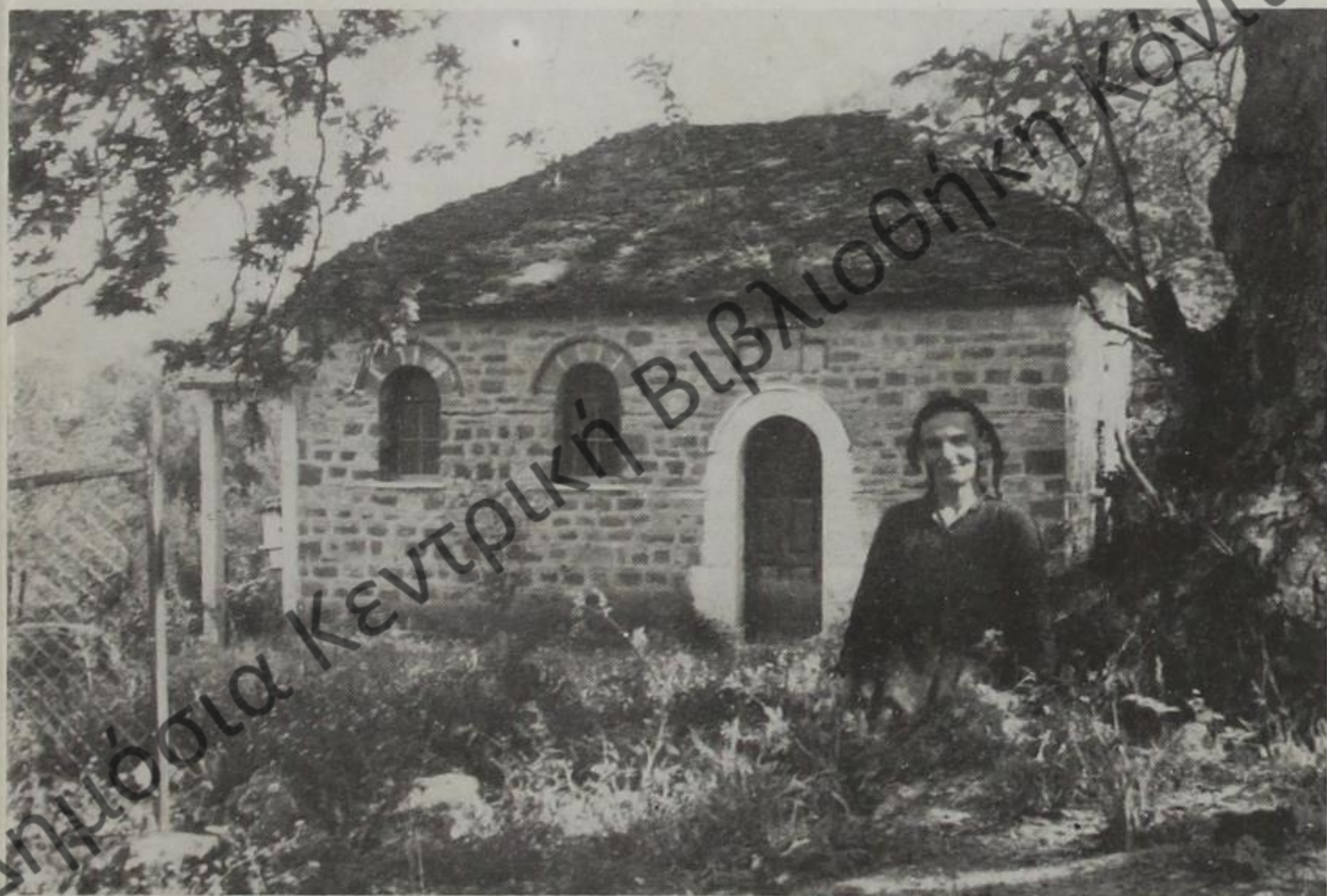
Το γραφικό παρεκκλήσι του Αγιάννη