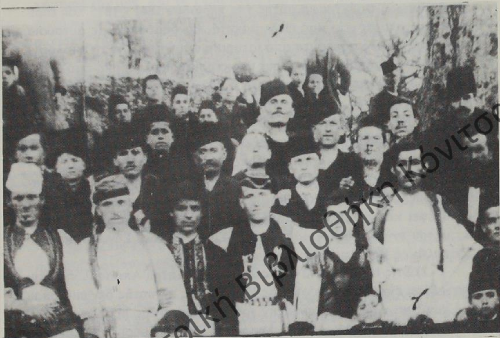
Κούλουμα εις Αγ. Σωτήρα επί τουρκοκρατίας