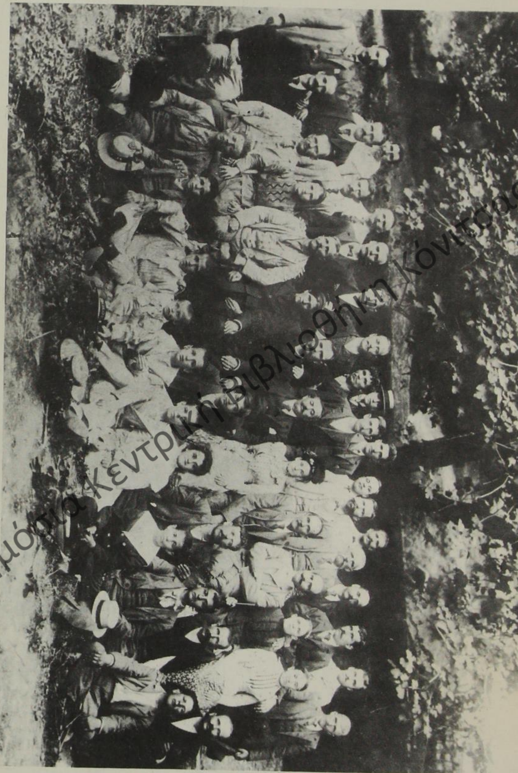
Φωτογραφία από εκδρομή της Φιλεκαπαιδευτικής Αδελφότητας Βούρμπιανης έτος 1901.