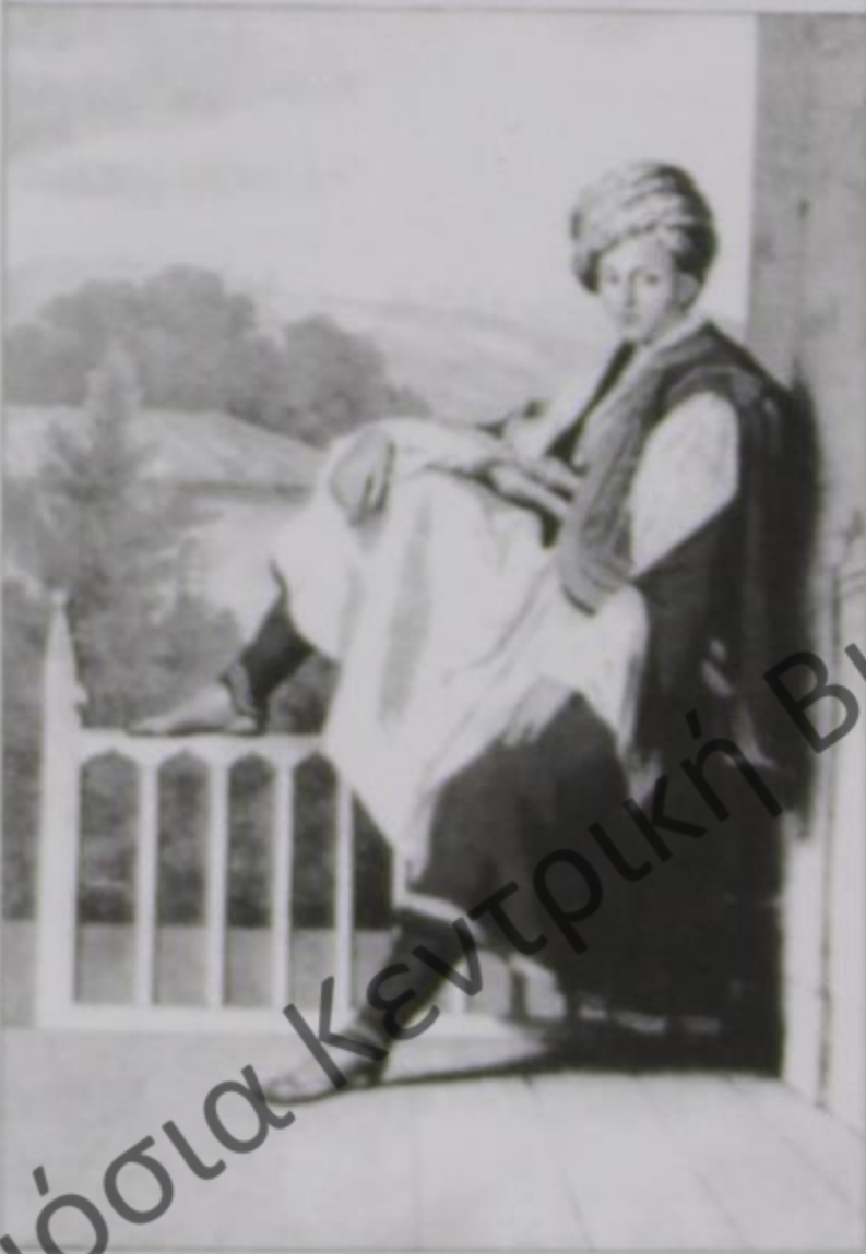
Εγγόνια Αλή Πασά κατά L. Dupri (1819) από το έργο του Voyage à Athènes et Constantinople (Έκδοση 1825)

Αλή Πασάς μαθών την αποστολήν του Ρήγα εις τον εν Βελιγραδίω Πασάν, έγραψε μ' επίτηδες ταχυδρομόν προς αυτόν παρακαλών να τω κάμει την χάριν πέμπων αυτόν εις Ιωάννινα». Ο ίδιος ο Ψαλίδας είχε εξομολογηθεί