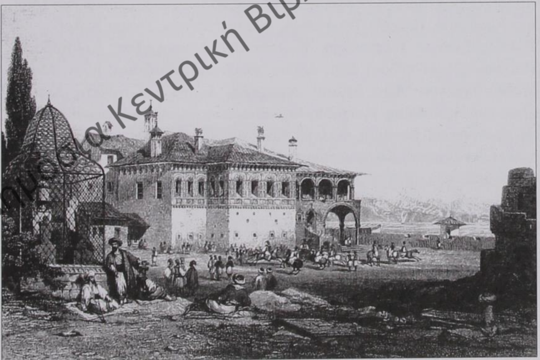
Το σαράϊ του Αλή Πασά στα Γιάννενα.

«Τριάντα πέντε χρόνια», λέει πέρασαν από τότε που εμφανίστηκε ο Αλή Πασάς κι όλα μέσα σ' αυτά τα τριάντα πέντε χρόνια άλλαξαν. Κι αυτό είναι το έργο του Αλή Πασά.