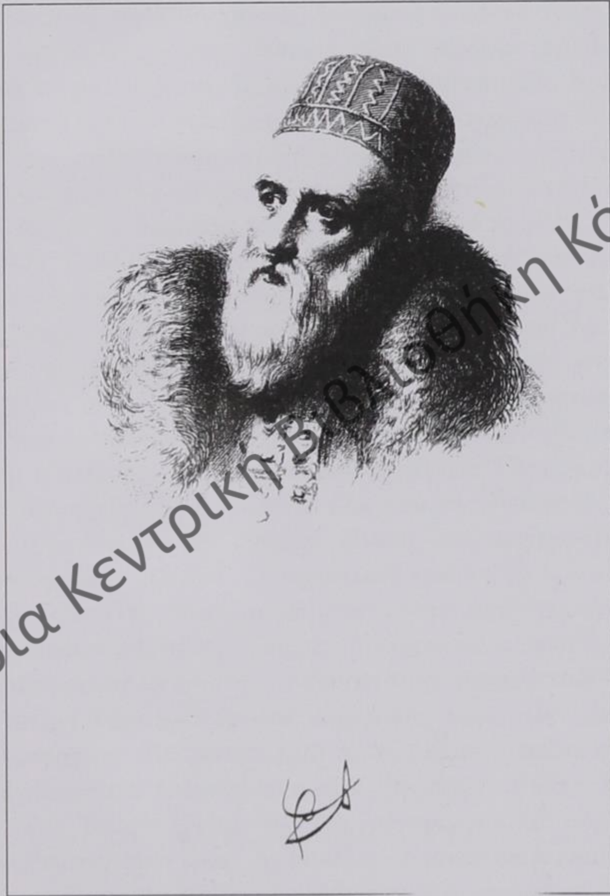
Αλή Πασάς. Χαλυβογραφία του W. Finden –εκ του φυσικού– με υπογραφή του βεζύρη. Από το βιβλίο των αδελφών Finden «A portrait illustration to the life and works of Lord Byron» (London 1834)