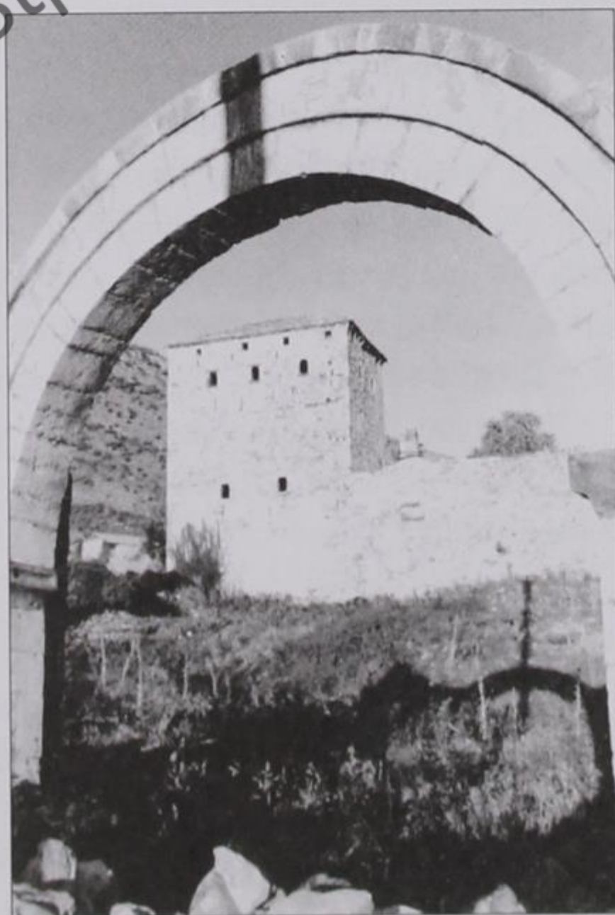
Ερείπια του πατρικού σπιτιού της Χάμκως-Κόνιτσα

Για να πλησιάσουμε όμως, όσο γίνεται πιο πολύ την αντικειμενική αλήθεια, δεν πρέπει ν' αποσιωπήσουμε και το γεγονός ότι η μεθοδολογία, οι μέθοδοι δηλαδή και τα συστήματα που χρησιμοποίησε ο Αλήπασας για να φτάσει στα παραπάνω αποτελέσματα υπήρξαν τις περισσότερες φορές σκληρές, απάνθρωπες κι απαράδεκτες, εγγίζοντας πότε-πότε τα έσχατα όρια. Εδώ είναι που πρέπει να μελετήσουμε τα ήθη και τις συνήθειες κείνης της εποχής. Να συγκρίνουμε. Να μετρήσουμε τ' αποτελέσματα. Το χρονικό διάστημα μέσα στο οποίο επιτεύχτηκαν. Κι έπειτα να δικάσουμε, ανεπηρέαστοι από τις φήμες και τις κραυγές, προπαντός απ' τις κραυγές εκείνων που αδικούσαν και χτυπήθηκαν. Κείνων που μεμψιμοιρούσαν και παραμερίστηκαν. Κείνων που από ιδεοληψίες και φανατισμό βλέπουνε στραβά. Να παραβλέψουμε τις κραυγές των λύκων όταν κάποιος άλλος σφάζει τα πρόβατα. Ν' αντιμετωπίσουμε κατάματα το φτωχό που χόρτασε ψωμί. Τη μάνα που είδε τα παιδιά της και τον άντρα της στο σπίτι. Τον έμπορο που σιγούρεψε τιςπραμάτιες του. Τον ταξιδιώτη που πέρασε τα λαγκάδια και τα δάση δίχως φόβο. Τον αγρότη και το χωρικό που απαλλάχτηκαν από τον αγά και το σιούμπλαση.