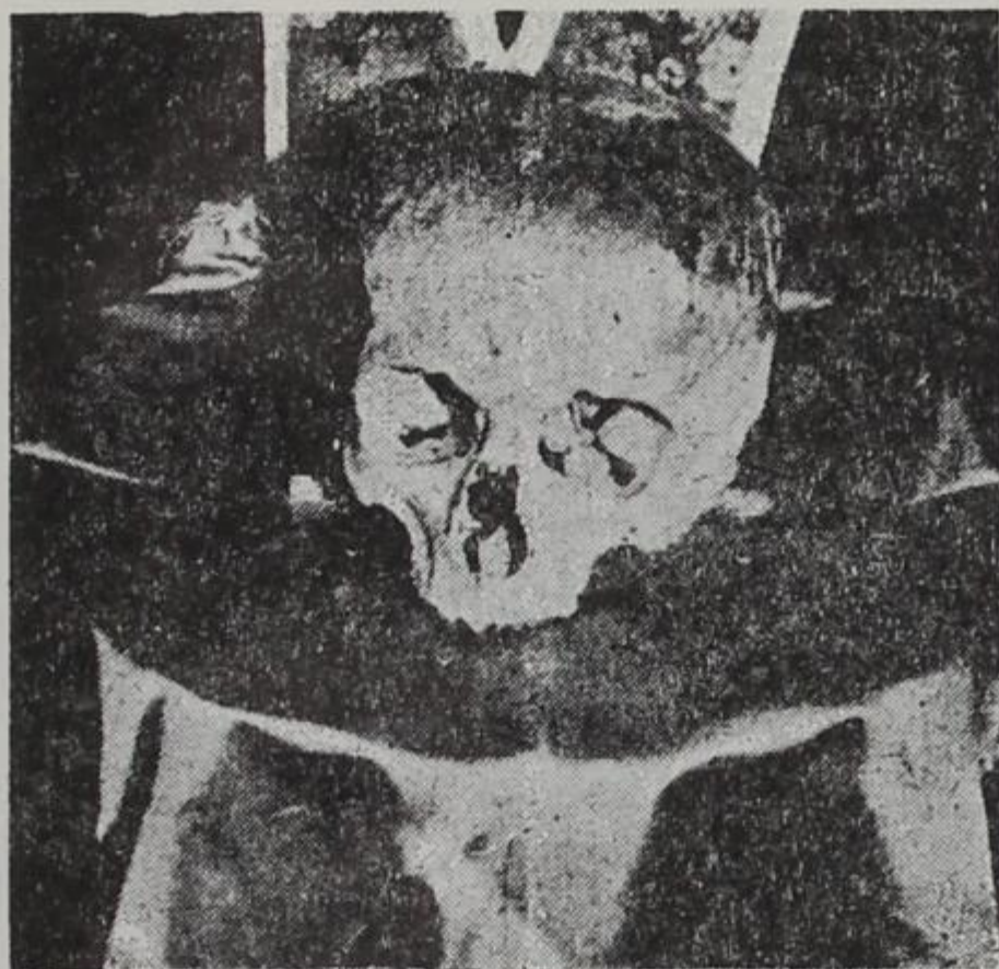
Ἡ τιμία κάρα τοῦ Ἁγίου Ἰωάννου