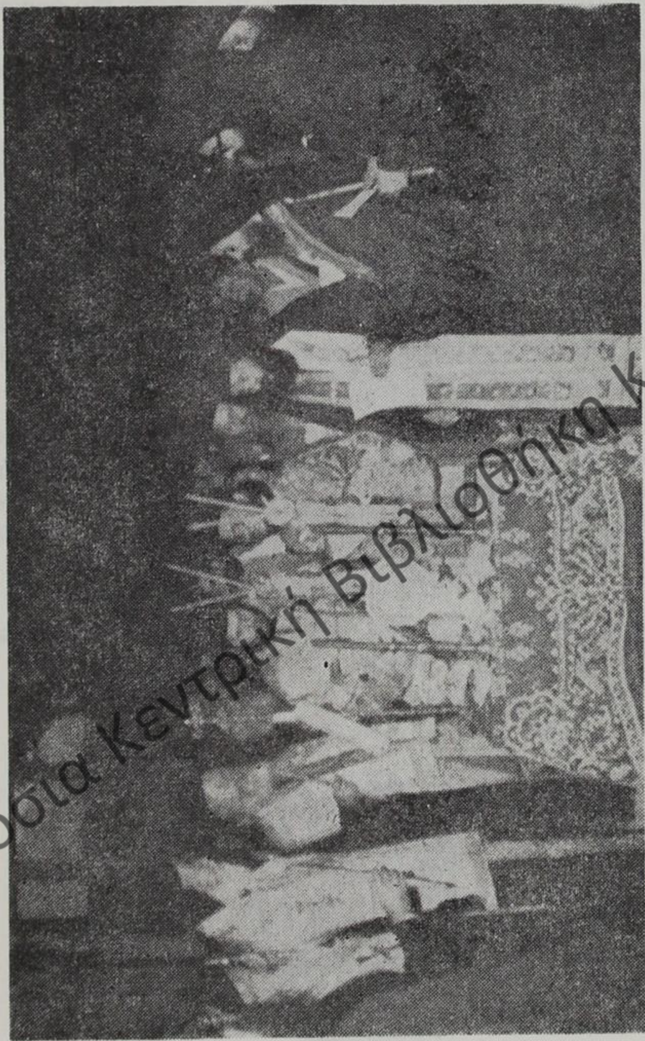
Στις 23 Σεπτεμβρίου 1978 ή Κόνιτσα υποδέχτηκε τον Ένδοξο "Αγίο της.