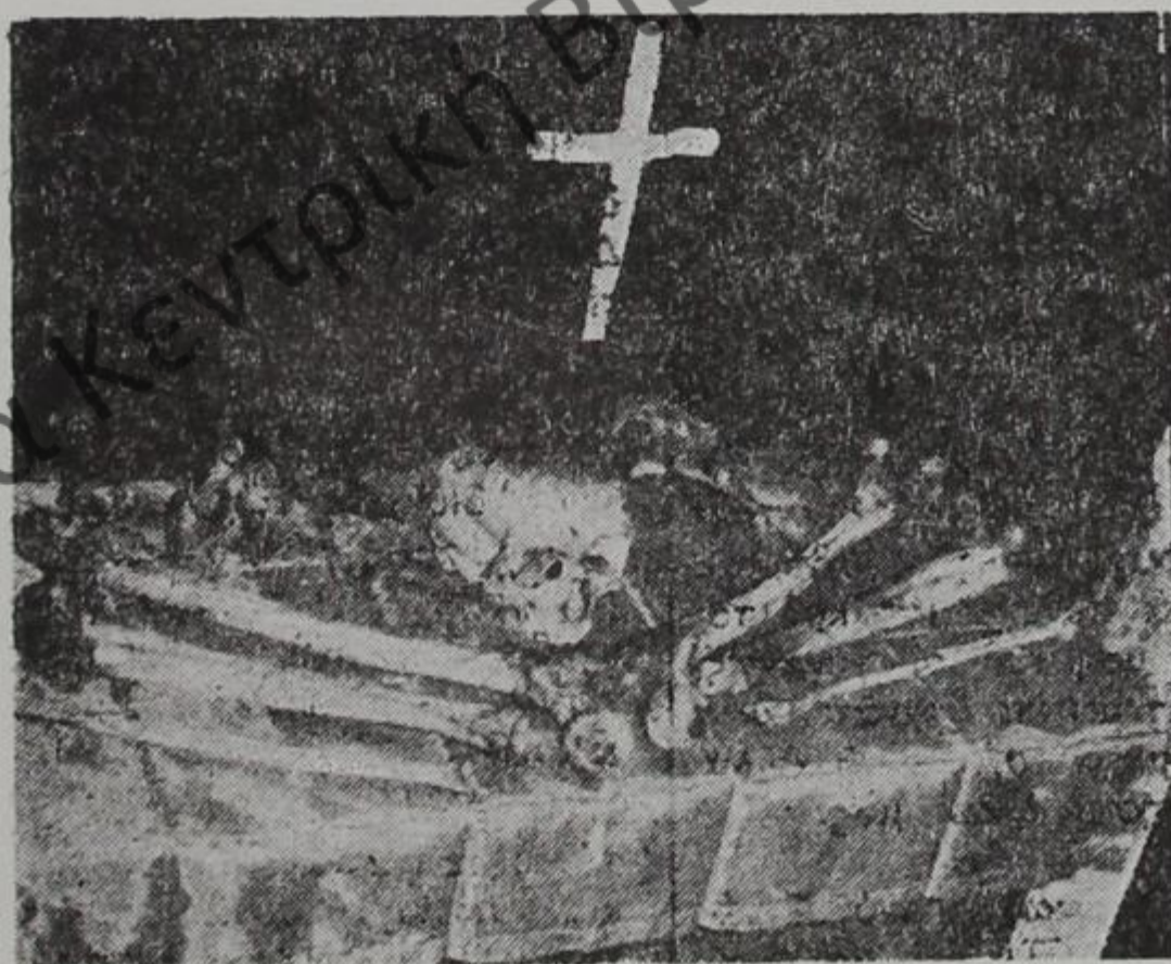
Τὰ εὐρεθέντα ἱερὰ λείψανα τοῦ Ἁγίου Ἰωάννου. (Βλέπε σημ. 6)