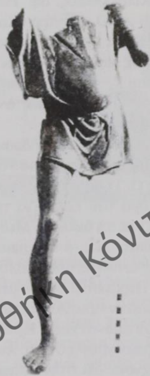
Ἀγαλμάτιο ἀπὸ Παλιογορίτσα(;) Κόνιτσας

Ἡ γνώμη μου εἶναι ὅτι στὰ ὕστερα Βυζαντινὰ χρόνια, ἐκτὸς ἀπὸ τὸν οἰκισμό μέσα κι ἔξω ἀπὸ τὸ Κάστρο ἀναπτύσσεται κι ἕνας ἄλλος οἰκισμὸς στὸ σημεῖο πού οἱ παλιοὶ Κονιτσιῶτες ὀνόμαζαν Παλιοχώρι (στὸ σημερινὸ Παζάρι τῆς Κόνιτσας). Ἡ ἀνάπτυξη τοῦ οἰκισμοῦ αὐτοῦ κατὰ πάσα πιθανότητα ἀποτελεῖ ἐξέλιξη τῆς ἐμποροπανήγυρης πού γίνονταν ἐκεῖ ἀπὸ παλιότερα χρόνια (πάντως μετὰ τὸ πέρασμα τῶν σλάβων ἀγροτοποιμένων ἀπὸ τὴν περιοχὴ, γιατί τὸ ὄνομα Κόνιτσα πού θὰ πεῖ ἀλογοπάζαρο, ἦταν καὶ τὸ ὄνομα τῆς ἐμποροπανήγυρης).