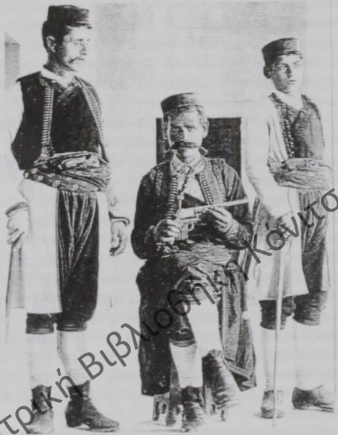
Κονιτσιώτες με παραδοσιακές στολές (1890)

Στον καζά έπικεφαλής του διοικητικού ήταν όπως είπαμε ο κατής. Οί άναπληρωτές του Κατή λέγονταν Ναϊμπηδες . Ό κατής ήταν άνώτατος πολιτικός, διοικητικός, δικαστικός άρχοντας και ταυτόχρονα προϊστάμενος όλων των κοινωφελών ιδρυμάτων του καζά. Για τά θέματα δημόσιας τά-