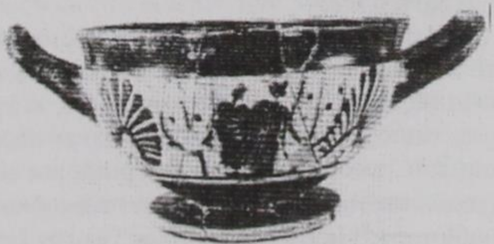
Οινοχόες, ληκύθια κλπ. από ανασκαφές Λιατοβουνίου-Κόνιτσας.