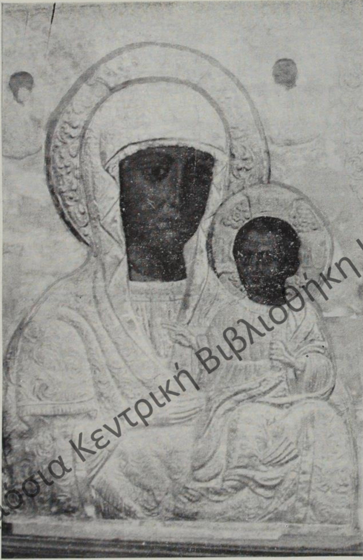
Ἡ Πάνσεπτος καὶ θαυματουργὸς εἰκὼν τῆς Παναγίας τῆς Πωγωνιανίτισσας, ἢ «Χρυσοῖς κροσσοῖς περιεβλημένη, πεποικιλμένη», ἡ ἱστορηθεῖσα ὑπὸ τοῦ εὐσεβοῦς Βυζαντινοῦ Ἀυτοκράτορος Κωνσταντίνου τοῦ Πωγωνάτου.