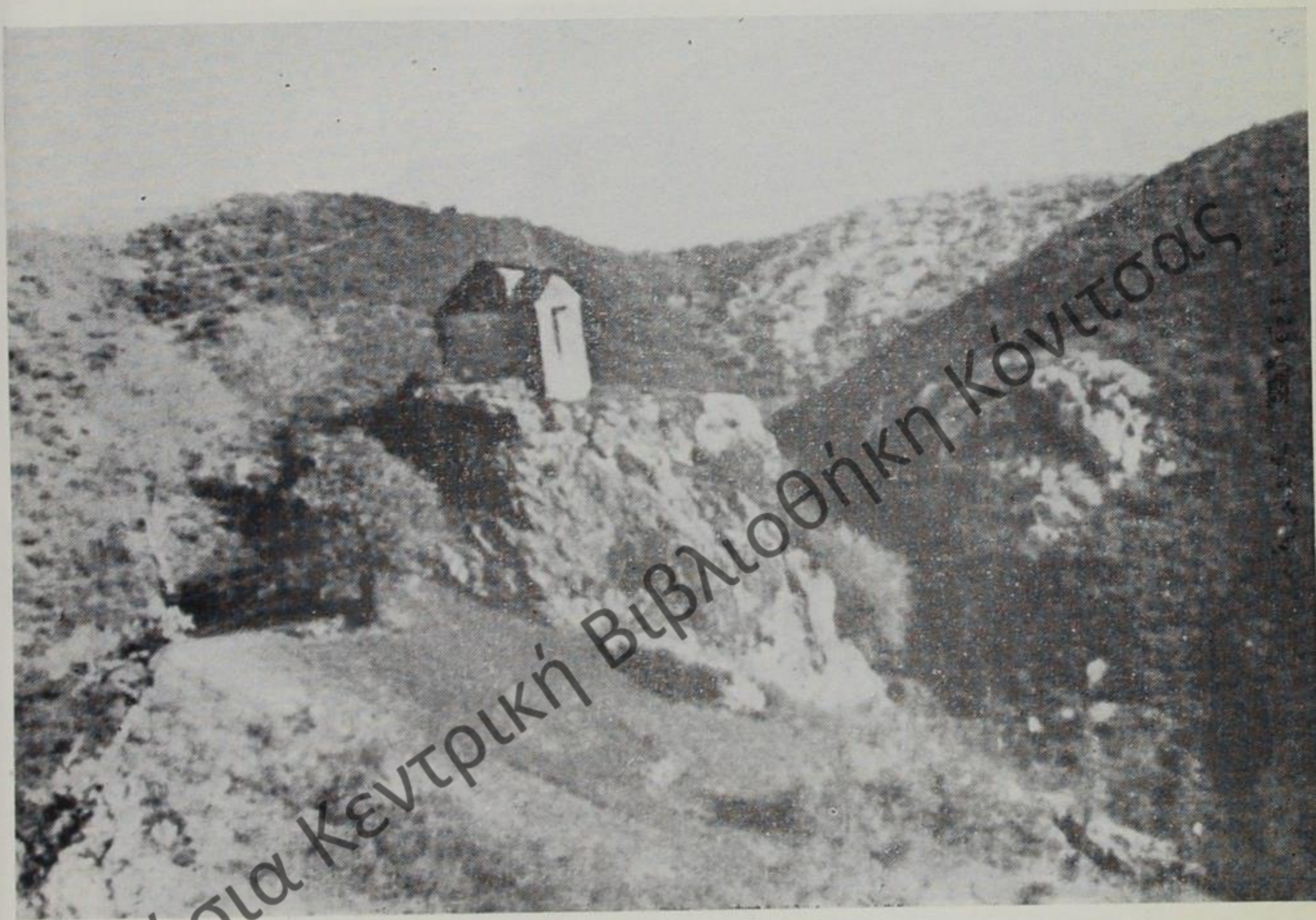
Ἰερός Βυζαντινὸς Ναὸς τῆς Ἀγίας Τριάδος, ἐκτισμένος, κατὰ τὸν Μεσαίωνα, ἐπὶ πανηγύλου καὶ ἀποτόμου βράχου