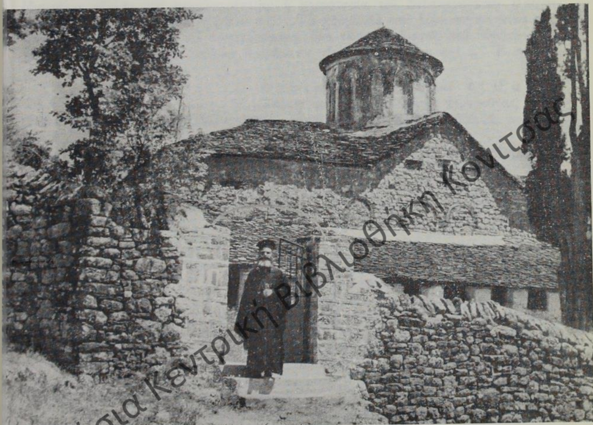
Ἱερός Βυζαντινὸς ναὸς τῶν Ἁγίων ἐνδόξων καὶ Πανευφύμων Ἀποστόλων, ἐπὶ ὀλοκλήρους ἑξατονταετηρίδας χρησιμεύσας ὡς Μητροπολιτικὸς ναὸς τῆς Ἀρχιεπισκοπῆς Πογωνιανῆς.