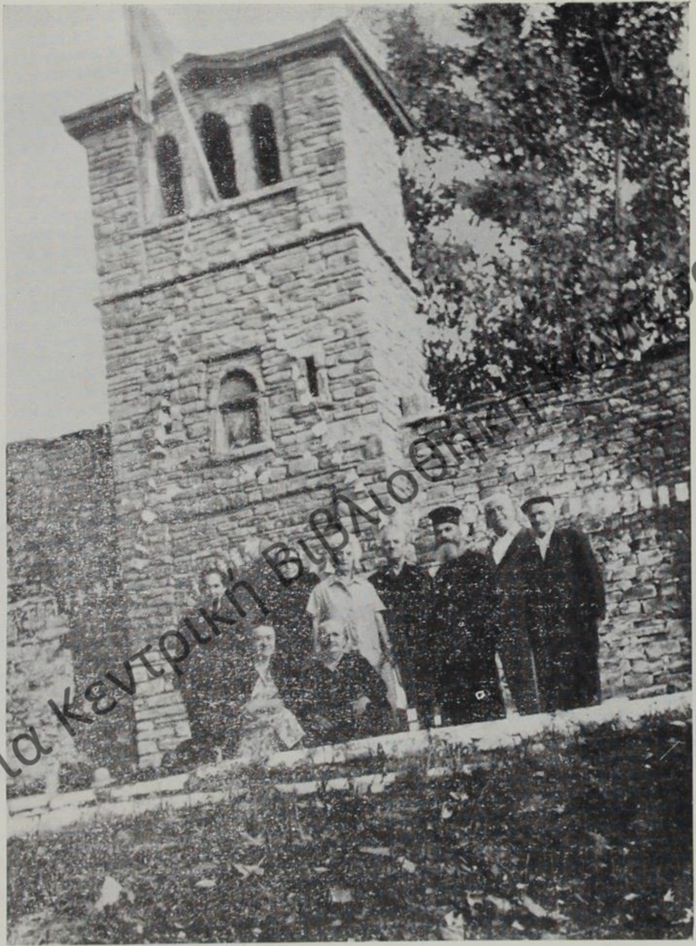
Καλυμάρμαρον Βυζαντιοπρεπές κωδωνοστάσιον τῆς Ἱερᾶς Σταυρο- πηγιανῆς Μονῆς Μολυβδοσκεπάστου.