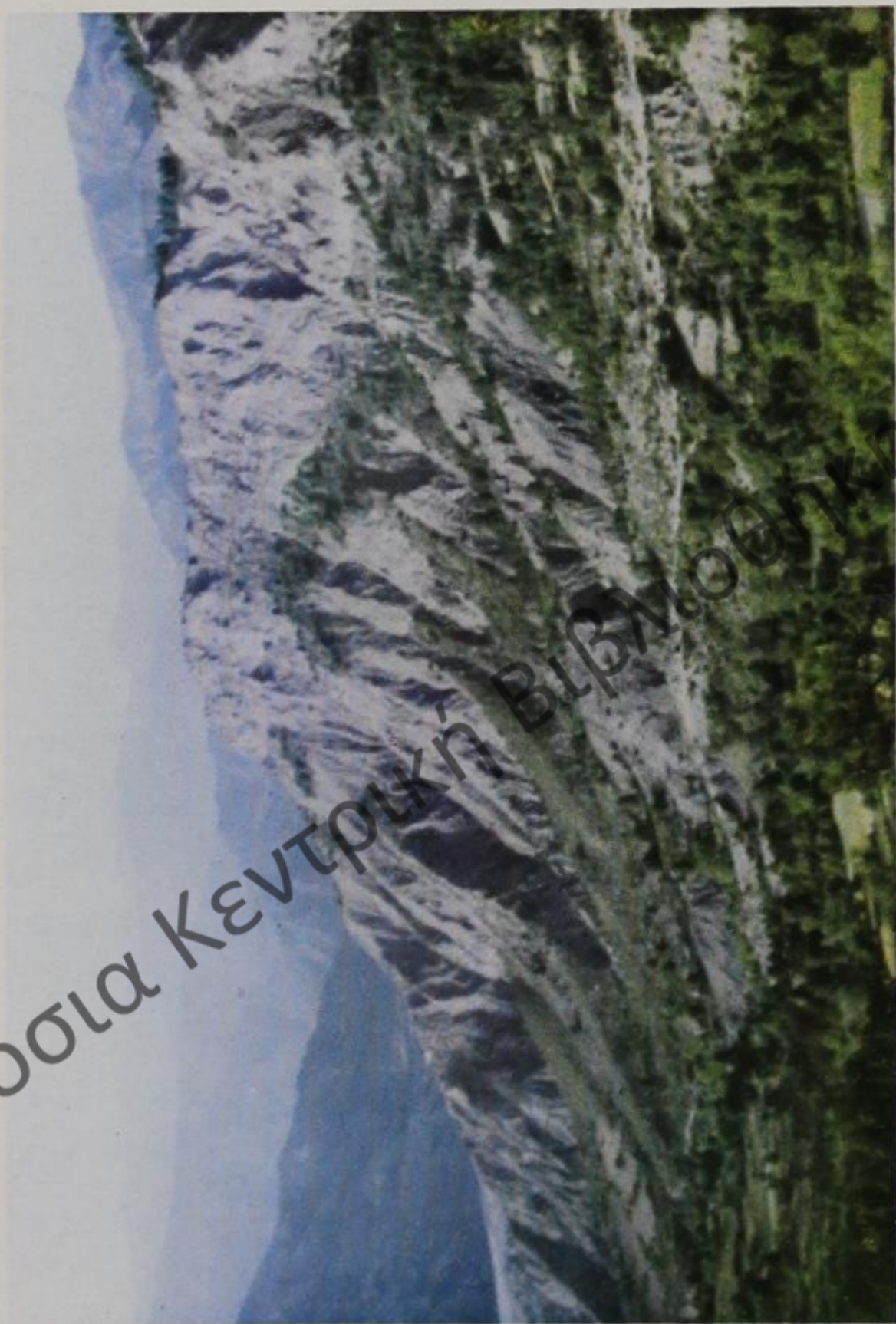
Τ' απόκρημνα Σταλάϊματα.