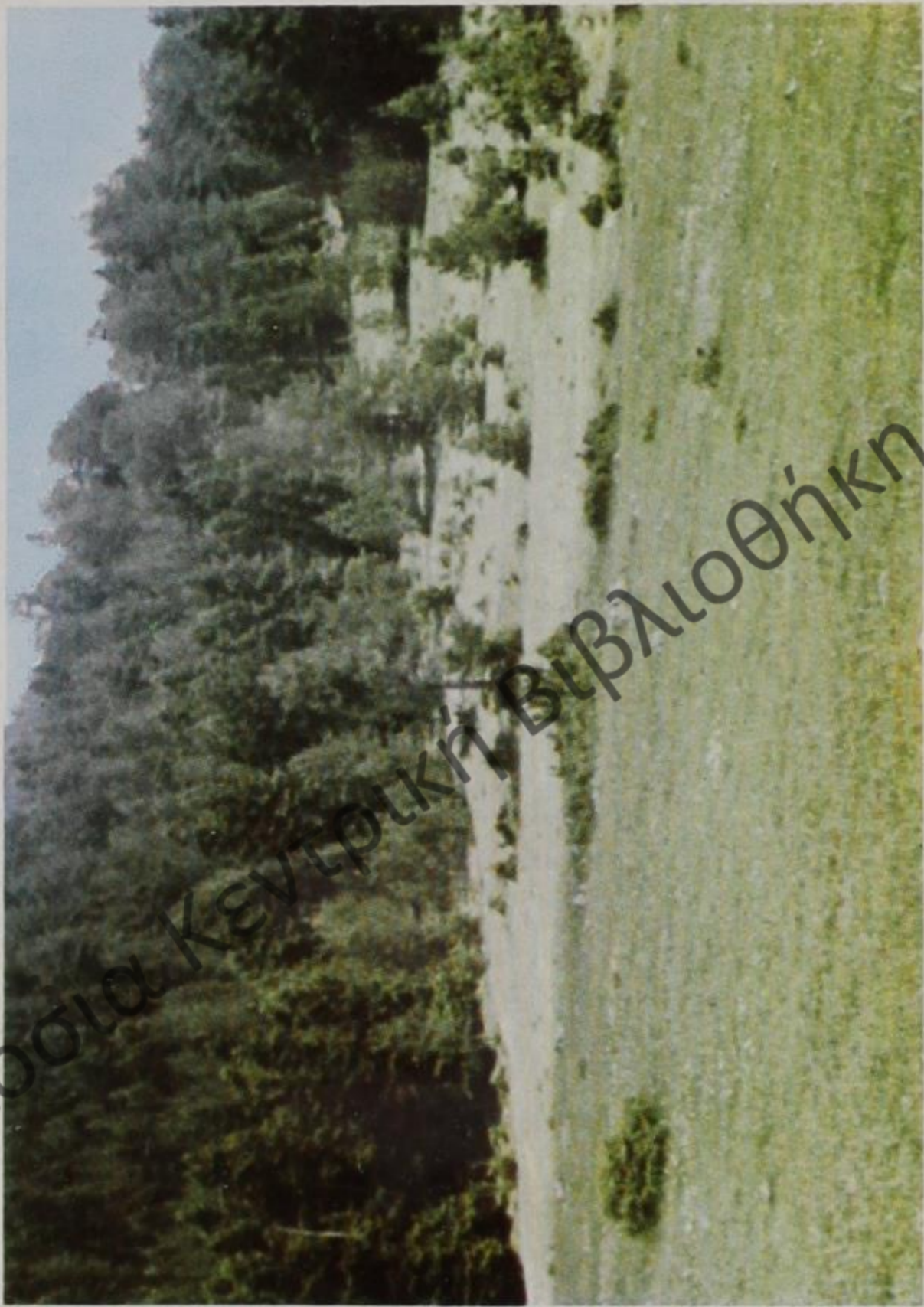
Τὰ ξέφωτα τῆς Λέσιαντζας.