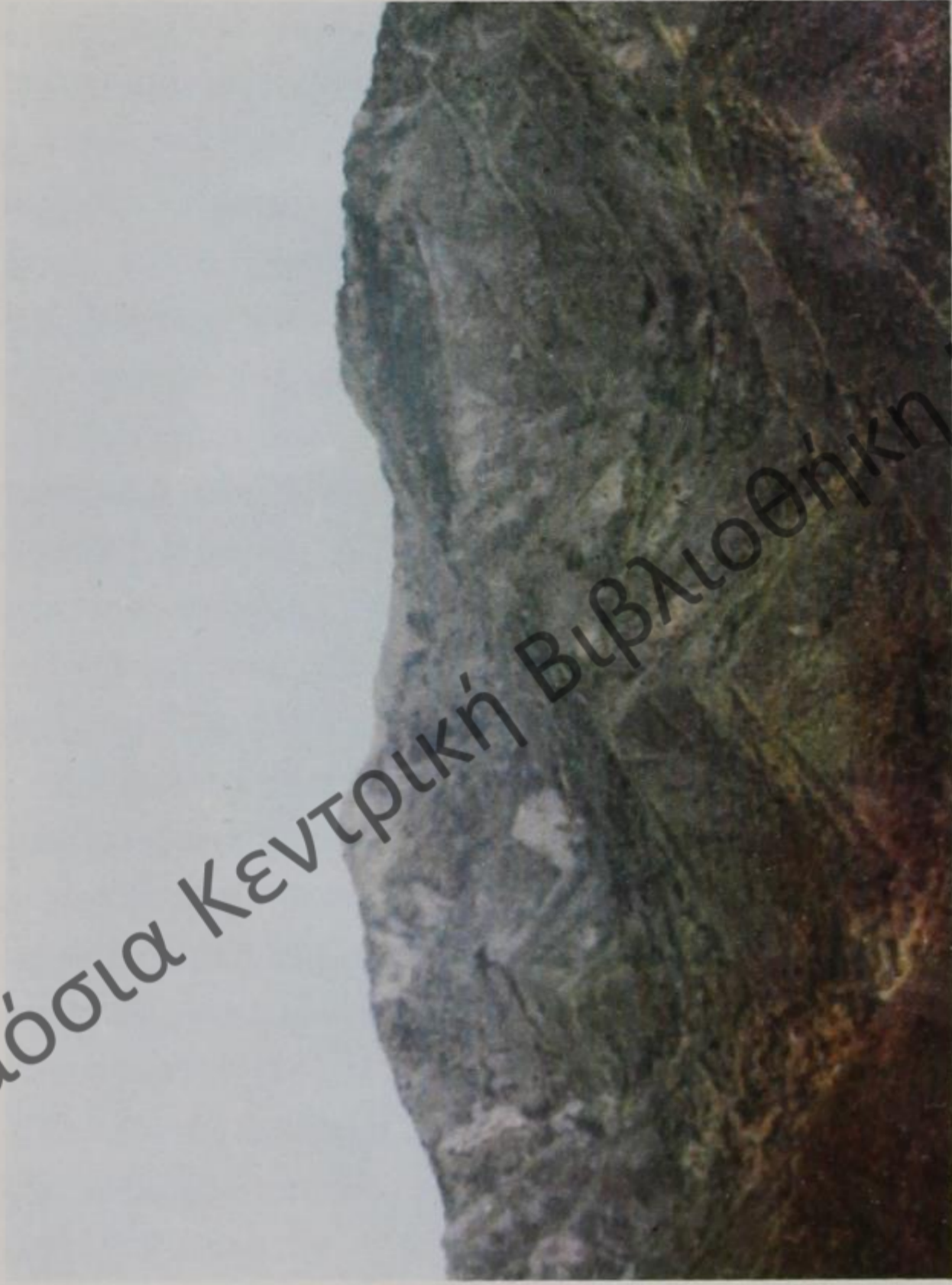
Τὸ περιβόλι καὶ ἡ Γύφτισα.