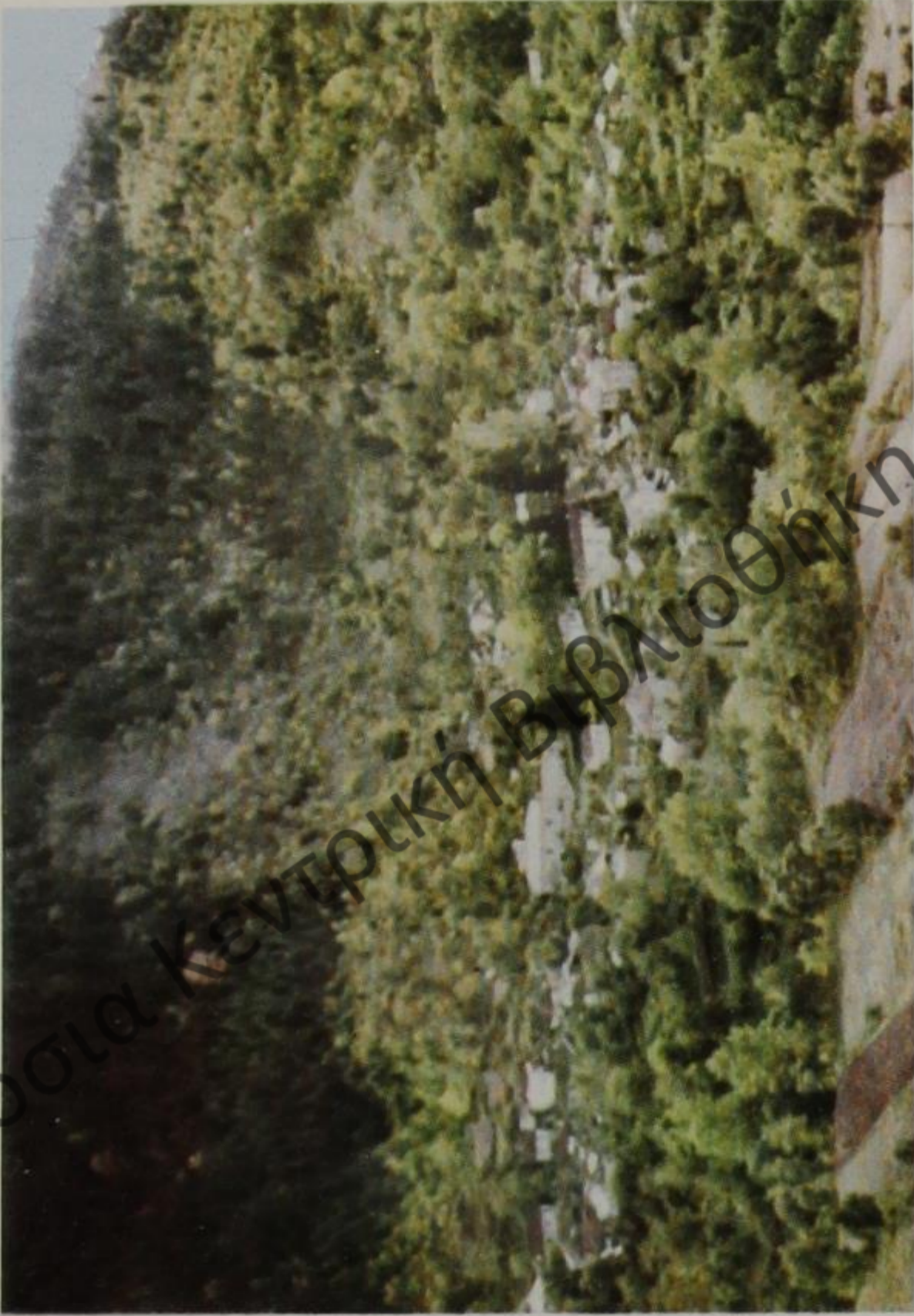
"Αποψις τοῦ χωριοῦ μας.