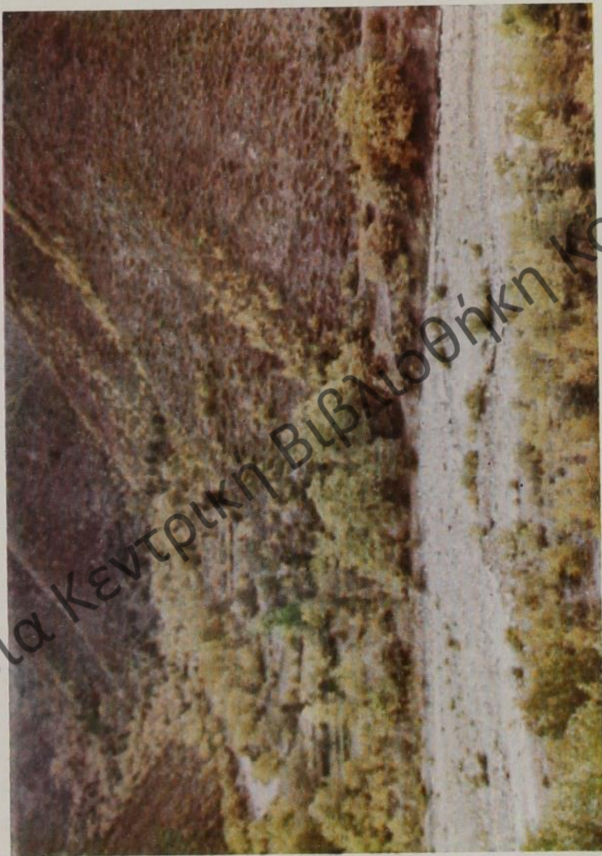
Ο Νταμπακόμυλος στον βουρκοπόταμο.