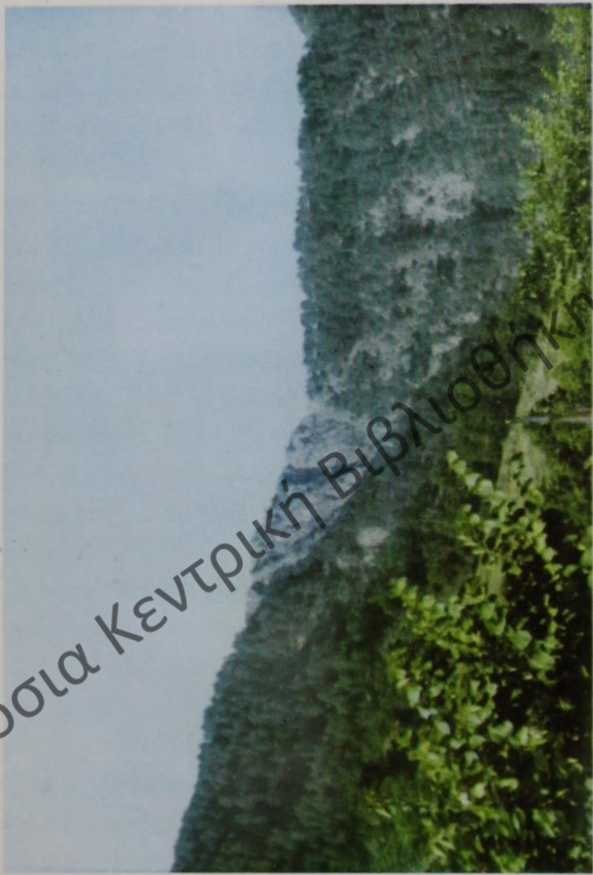
‘Η άγρια Δεμονχί.