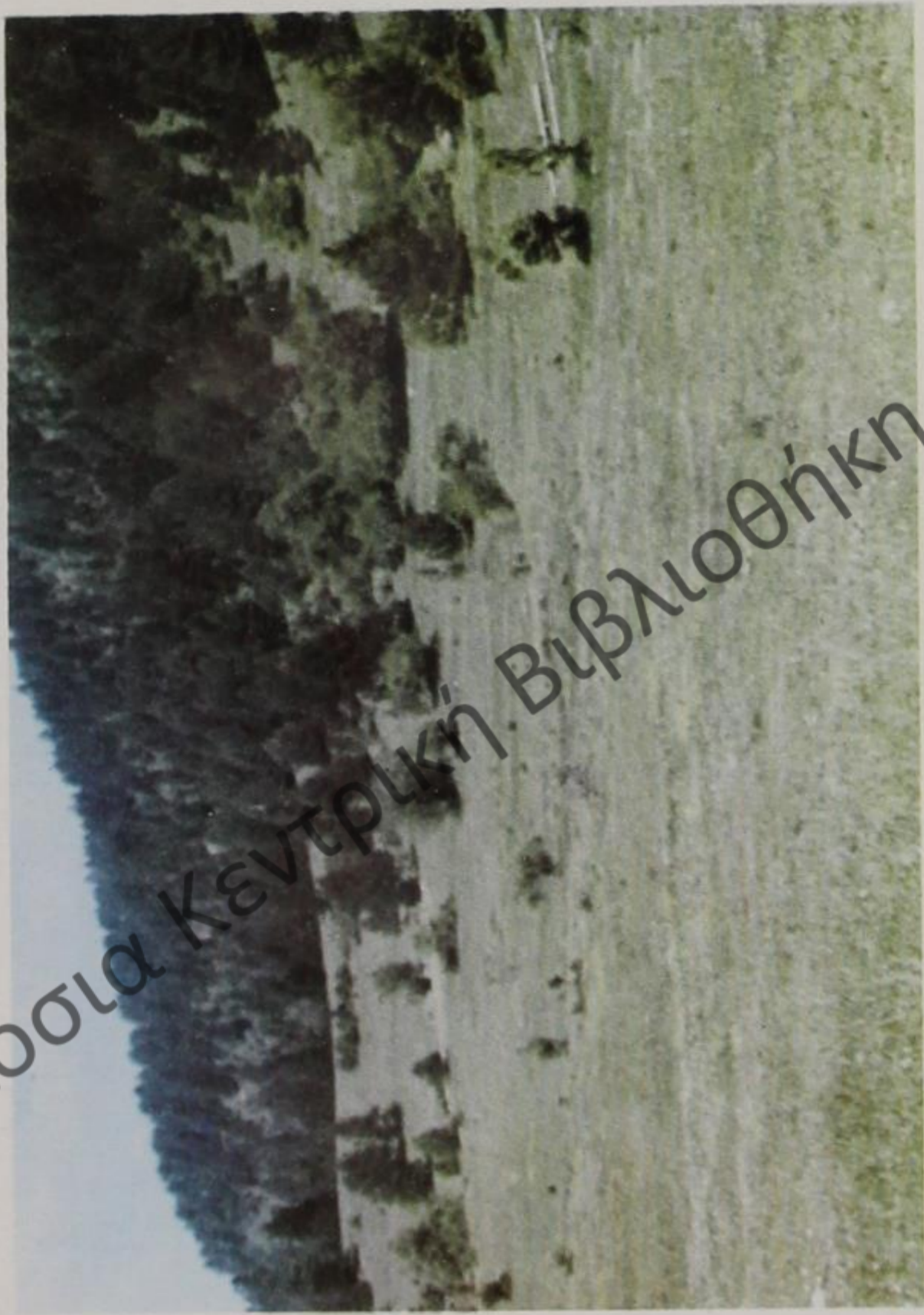
Τὰ εἰδυλλιακὰ λιβάδια τοῦ "Αἰ-Θόδωρου"