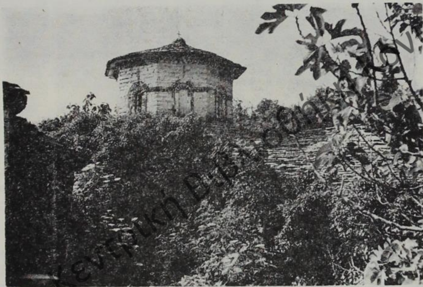
Ἡ ἱερά μονὴ Μακραλέξη.

Σὲ μιὰ περιοχὴ δασωμένη ἀπὸ δρῦες, σὲ τόπο ἔρημο καὶ θυθισμένο στὴ σιωπὴ. Ἡ τοποθεσία του εἶναι καθαρὰ μοναστική. Ἡ ἡσυχία ὀμιλεῖ μ' ἓνα ξεχωριστὸ τρόπο καὶ ὁ νοῦς τοῦ ἀνθρώπου διεισδύει στὸ χῶρο τῆς καρδιάς. Σ' αὐτὸν τὸν ὁμορφο τόπο,