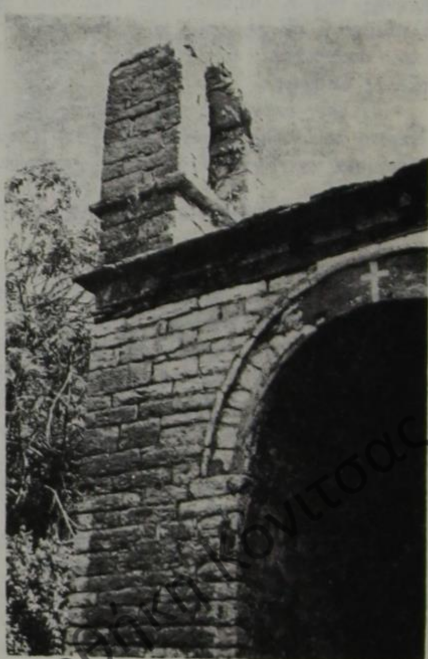
“Άγιος Ἰωάννης ὁ Βαπτιστής. Φορητὴ εἰκόνα. Τὸ καμπαναριὸ τῆς μονῆς Μακραλέξη. 5. ΑΛΛΕΣ ΠΛΗΡΟΦΟΡΙΕΣ ΚΑΙ ΠΑΡΑΔΟΣΕΙΣ

Τὸ μοναστήρι τὴν ἐποχὴ τῆς δόξης του εἶχε, ὅπως προαναφέραμε, μεγάλη κτηματικὴ καὶ δασικὴ περιουσία 11 . Παράλληλα διατηροῦσε πολλὰ ζῶα. Εἶναι ἐνδιαφέροντα τὰ ὅσα σημειώνει στὸ χειρόγραφο του ὁ Δημήτριος Οἰκονόμου: «Ἡ Μονὴ εἶχε καὶ ἱκανὴν ἰδιοκτησίαν. Εἶχε 22 στρέμματα ποτιστικῶν ἀγρῶν καὶ ἄλλα ξηρικῶν ἀρκετά. Εἶχε δύο ὕδρομύλους, ἓνα ἐλαιῶνα, λειβάδια, κήπους, ἀμπέλια, πολλὰ ὀπωροφόρα δένδρα, πολλές κυφέλες μελισσῶν, ἄφθονα πουλериκά, σιτηρά, νωπούς καρπούς καὶ ἔχρους, πολλὰ γαλακτοκομικὰ προϊόντα, κρέας, μαλλιά, καθόσον ἡ Μονὴ ἔτρεφε 600—700 γιδοπρόβατα, τὸ γάλα των δέ, διοχετεύετο εἰς τὴν Μονὴν διὰ σωλήνων (κιούγκια) ἐξ ἀποστάσεως ἀπὸ τὰ ποιμιστάσια τρισχιλίων καὶ πλέον μέτρων. Λείψανα δὲ τῶν τοιούτων σωλήνων σώζονται καὶ σήμερον. Πολὺ κρασί παρήγεν ἡ Μονὴ διότι σώζονται καὶ σήμερον πελώρια βαρέλια καὶ γενικῶς εἶχε πᾶν εἶδος διατροφῆς ἐκ τῆς παραγωγῆς τῆς, εἴτε ἐπιστασίας, εἴτε ἐκ γεωμόρου τῶν κτημάτων τῆς. Εἰρήσθω ὅτι ἔτρεφε καὶ ἀγελάδας καὶ βώδια διὰ τὰς καλλιεργείας τῆς περὶ τὰ 30 καὶ εἶχε καὶ 5 ἡμιόνους διὰ τὰς μεταφοράς καὶ μετακινήσεις τῶν μοναχῶν τῆς, χρείας τρεχούσης. Εἰς ταῦτα δέον νὰ προστεθῶσι καὶ αἱ δωρεαὶ τῶν χριστιανῶν προσκυνητῶν ἐξ ὅλης τῆς Ἡπείρου καὶ τῆς Β. Ἡπείρου, ὅσας εἶχομεν ἐλευθεροκοινωνίαν, τὰ ἀφιερώματα καὶ τὰ κειμήλια. Εὐνόητον μὲ τοὺς 40 μοναχοὺς ποὺ ἐκεῖ ἐμόναζαν καὶ τοὺς ἐργάτας καὶ καλλιεργητὰς λαϊκοὺς, ἐκεῖ ὑπῆρχε μία προοδευτικὴ κοινωνία».