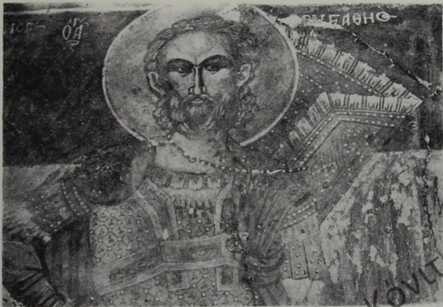
Ὁ ἅγιος Εὐστάθιος. Τοιχογραφία τῆς μονῆς Μακραλέξη..

Ἡ τέταρτη ἐκδοχή λέγει ὅτι ὁ κτίτορας Ἄλέξης κατοικοῦσε μακριὰ ἀπὸ τὸ μοναστήρι πὺ ἐχτίσε καὶ ὁ κόσμος ἔλεγε ὅτι εὐρίσκεται «μακριὰ ὁ Ἄλέξης», φράση πὺ ἀπλοποιήθηκε καὶ ἔγινε Μακραλέξη.