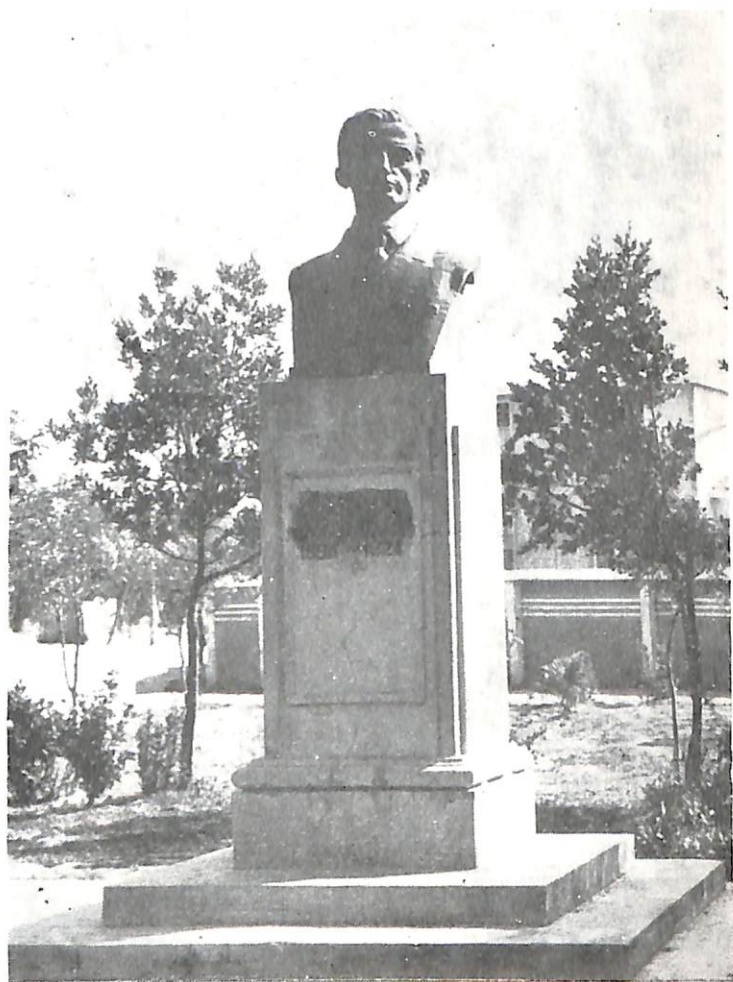
Busti i Heroit të Popullit A. Rustemi në Vlorë.