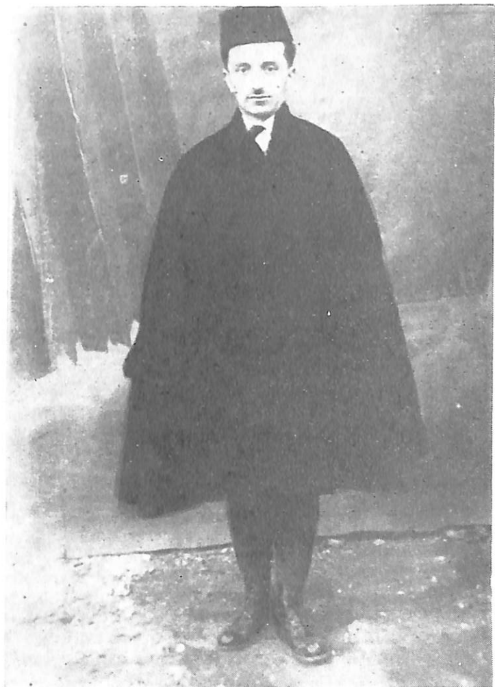
Avniu më 1921.