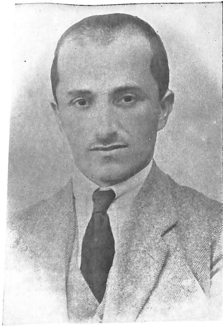
Avniu si asamblist më 19 prill 1924, një ditë para vrasjes nga agjentët e Ahmet Zogut.