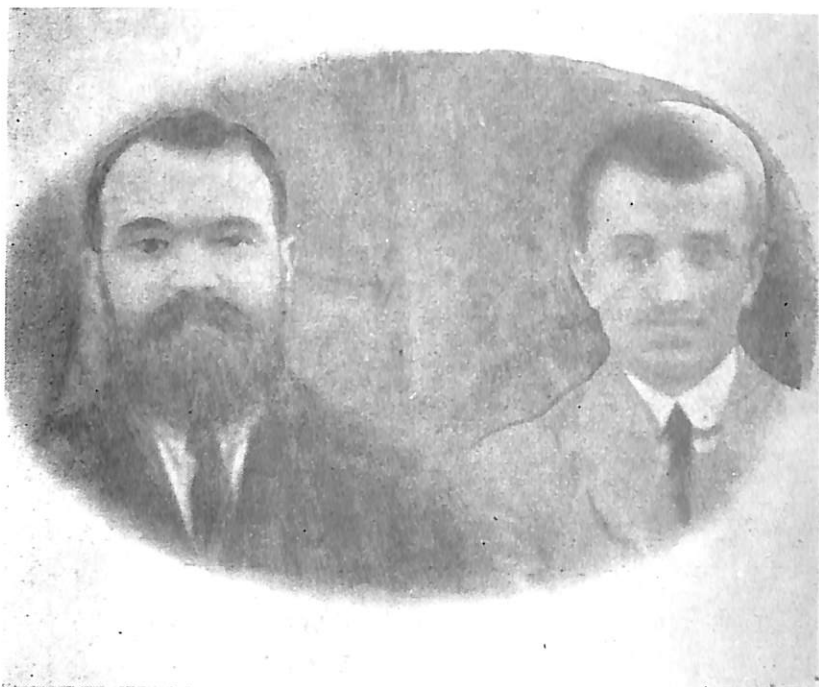
Fan Noli me Avni Rustemin.