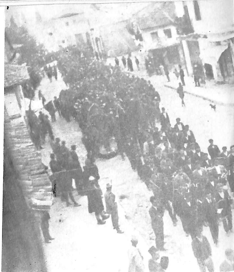
Varrimi madhështor i heroit në Vlorë, ku marrin pjesë rreth 10.000 veta.