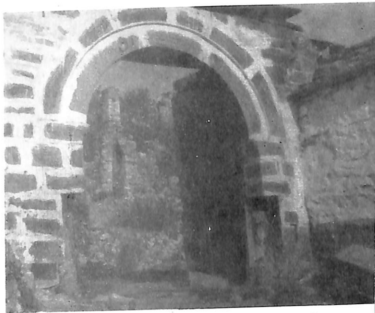
Shtëpia ku lindi Avni Rustemi, në Libohovë. (Porta e shtëpisë).