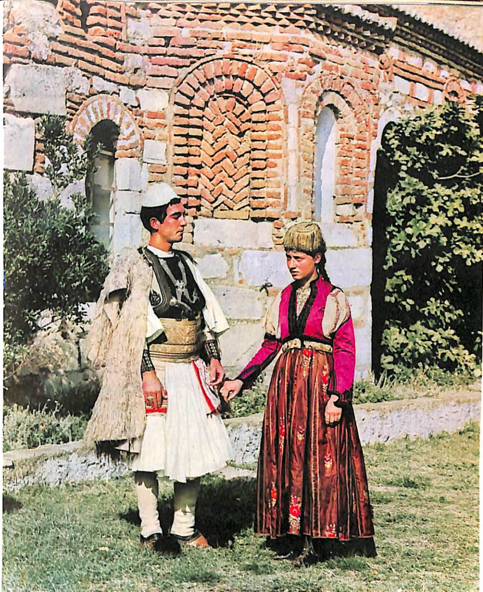
Të porsa fejuar (Myzeqe)