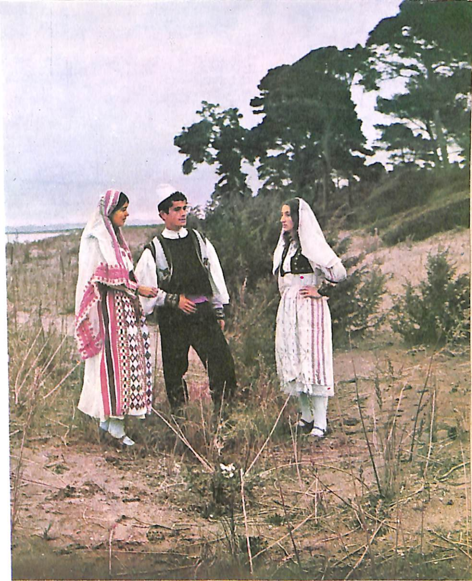
Veshje nuseje e dhëndëri (Myzeqe)