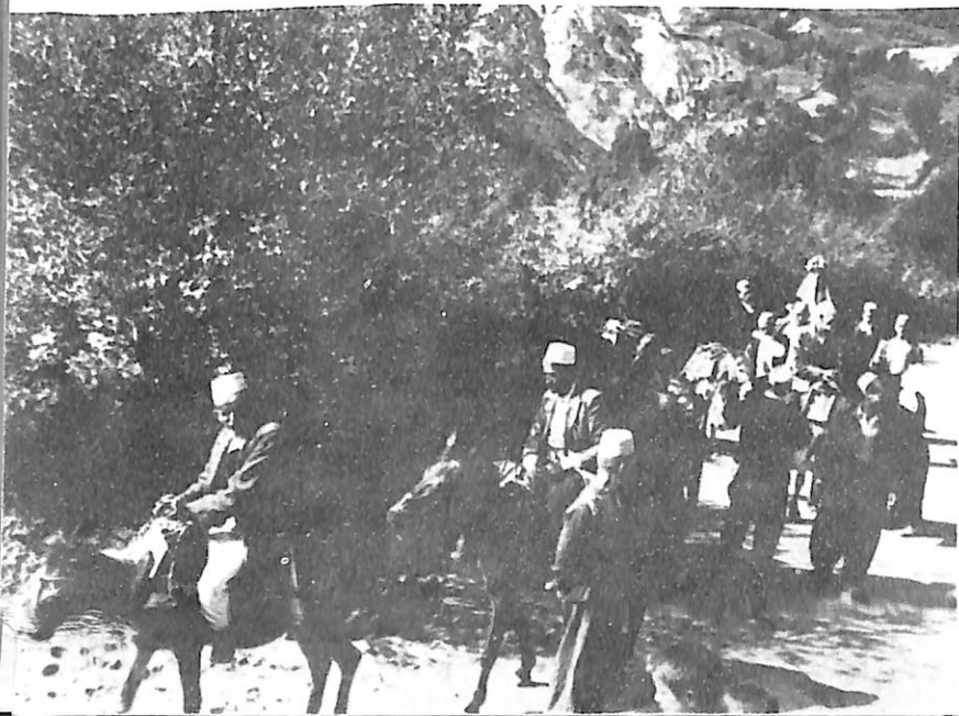
Krushqit me nusen në rrugë (Mat)