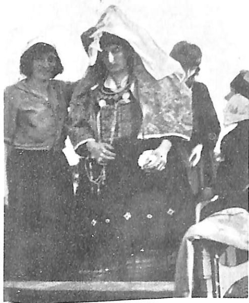
Përgatitja e nuses për të shkuar në shtëpinë e burrit – Malësi e Madhe (Shkodër)