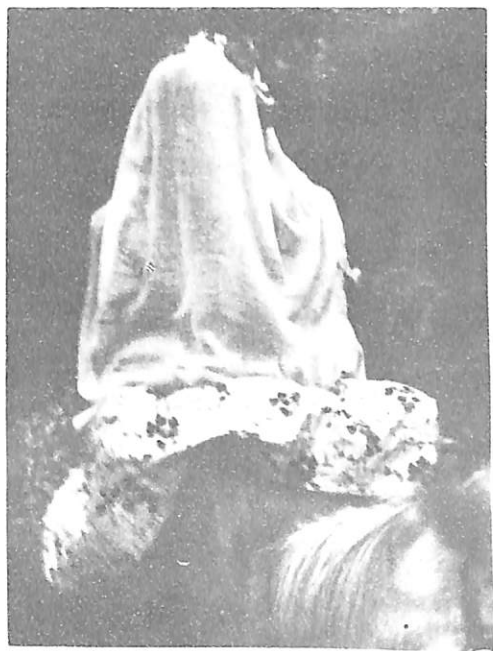
Nusja e mbuluar me duvak — Kërpicë (Tomorricë)