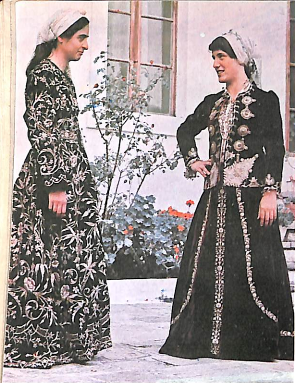
Moment dasme kolonjare