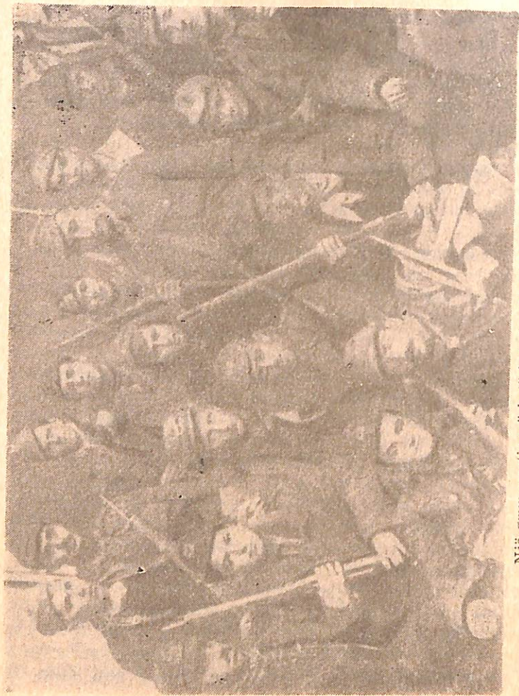
Një grup partizanësh të batalionit «Naim Frashëri».