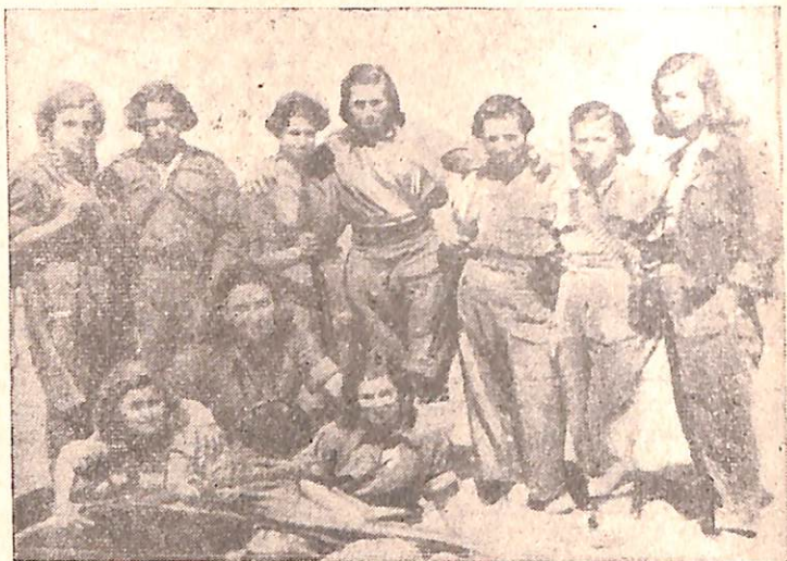
Partizane të Brigadës VII Sulmuese.

Vështirësitë po shtoheshin, bora vazhdonte të binte, ushqimi ishte i paktë dhe i keq, madje pati raste që partizanët nuk hanin fare ose ndanin nga një kokër patate. Vetëm për të sëmurët me vështirësi siguronin pak miell misri nëpërmjet komandës së vendit, gatuanin kaçamake me ujë e kripë.