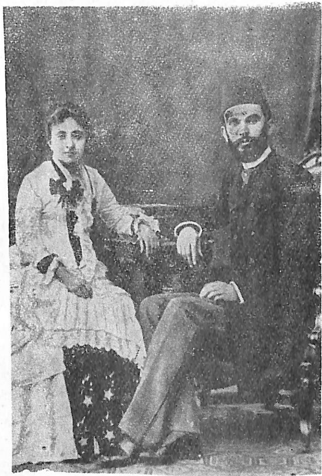
Samiu me gruan.