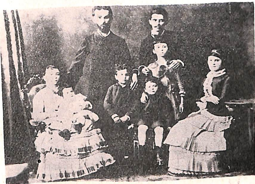
Samiu me gruan dhe me fëmijë dhe Naimi me gruan e vajzën.