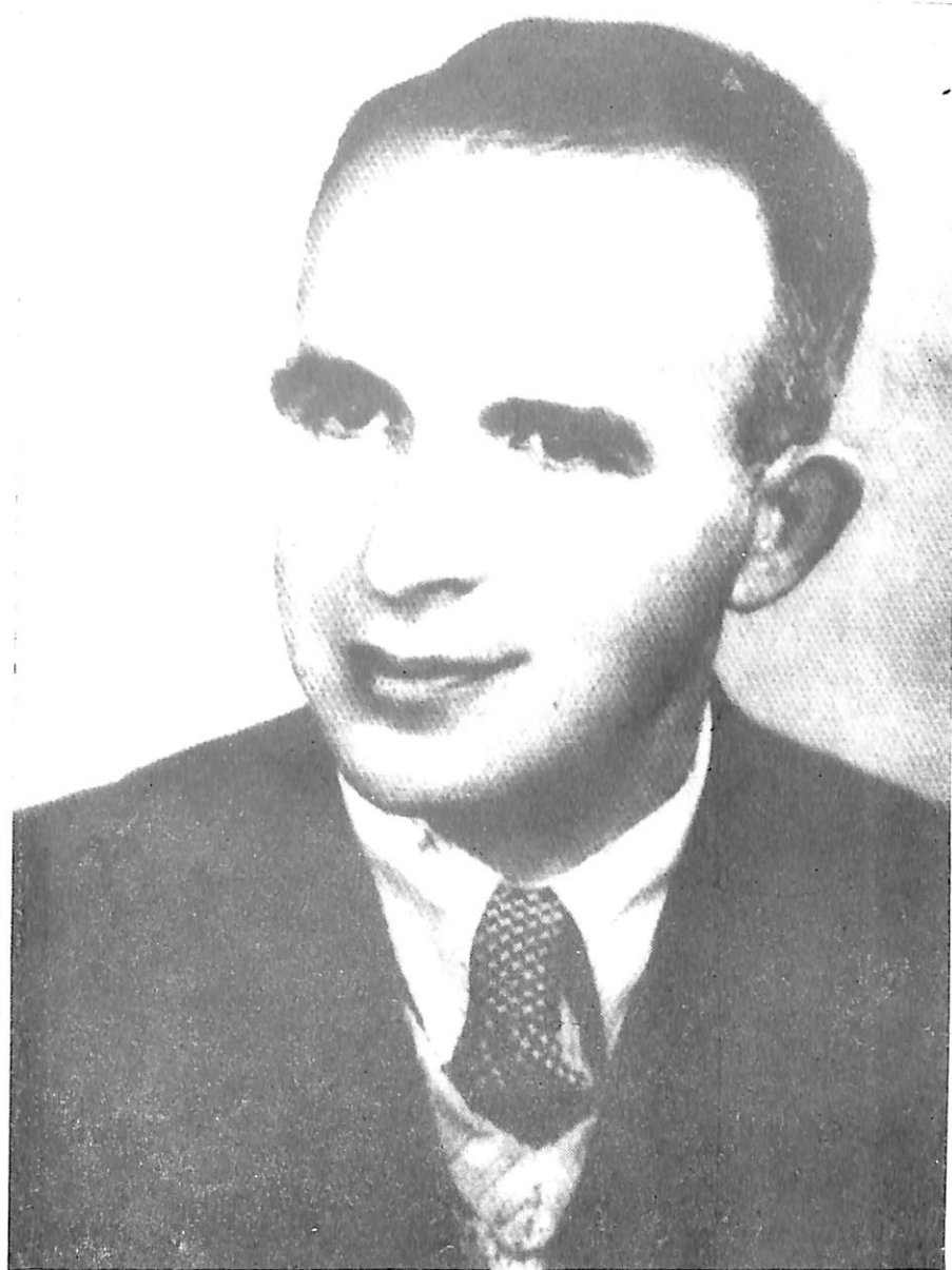
MITRUSH KUTELI (1907-1967)