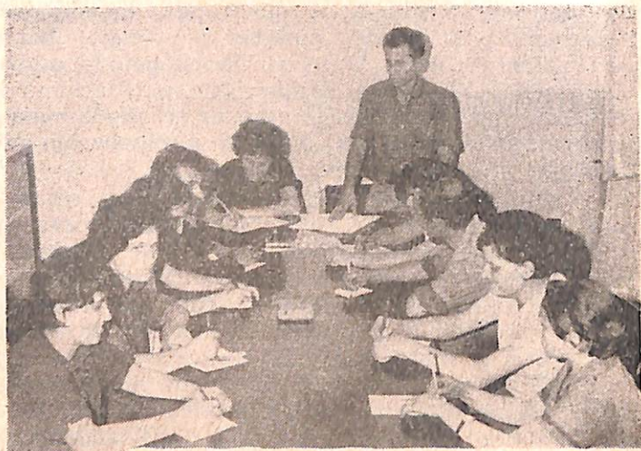
Konsulta për përhapjen e iniciativës «Maqinat të mos pushojnë»

I entuziazmuar nga sukseset e arritura, vetë kolektivi dyfishoi planin e prodhimit për vitin 1969. Njëzëri u vendos të ngriheshin 6 reparte dhe sektorë të tjerë prodhimi, të dyfishohej numri i artikujve dhe i asortimenteve të rinj të ndërtimit, të prodhoheshin mbi 30 maqineri e pajisje kryesore dhe mbi 140 pajisje e stampa për mekanizimin e prodhimit e artikujve të rinj.