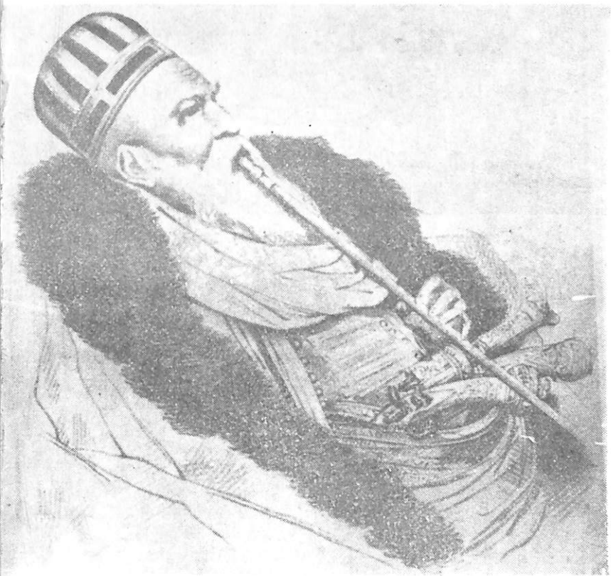
Ali pashë Tepelena Viz. Dupre (bot. Rëmerand)