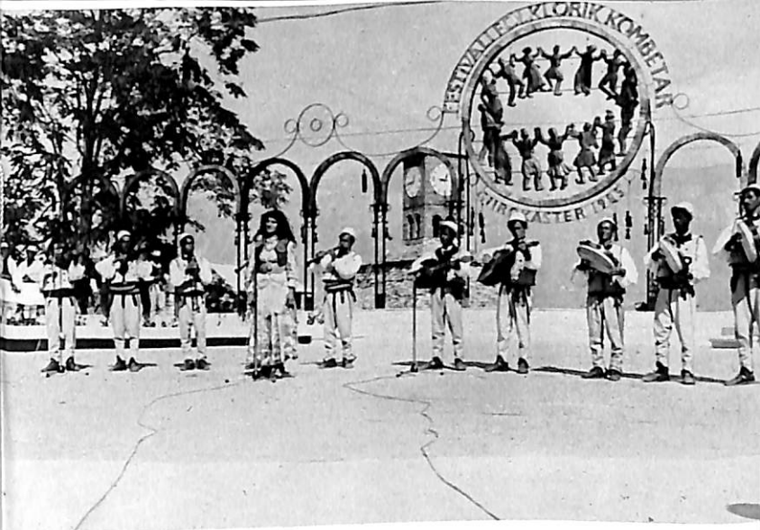
Gjatë Festivalit Folklorik Kombëtar, Gjirokastrë, 1983.