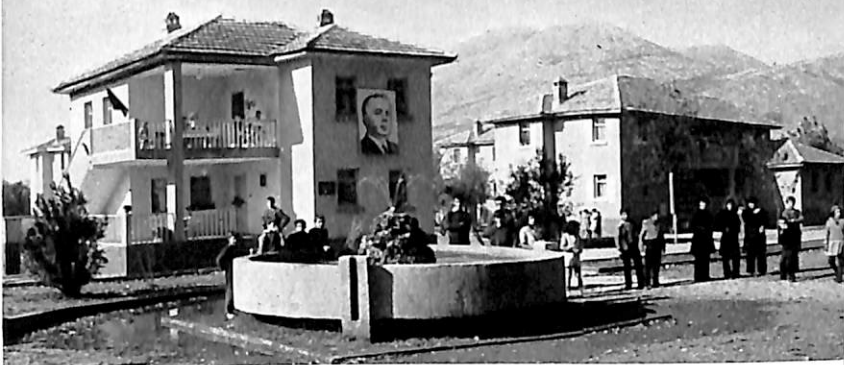
Lagjja e Bahçallëkut, e re dhe e bukur në hyrje të Shkodrës

Në pragun e përrimit. Nga fshati i shkatërruar nuk ka mbetur asnjë gjurmë.