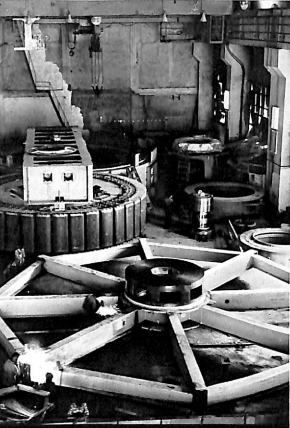
Nga puna për ndërtimin e montimin në kantieret e hidrocentralit „Enver Hoxha” në Koman