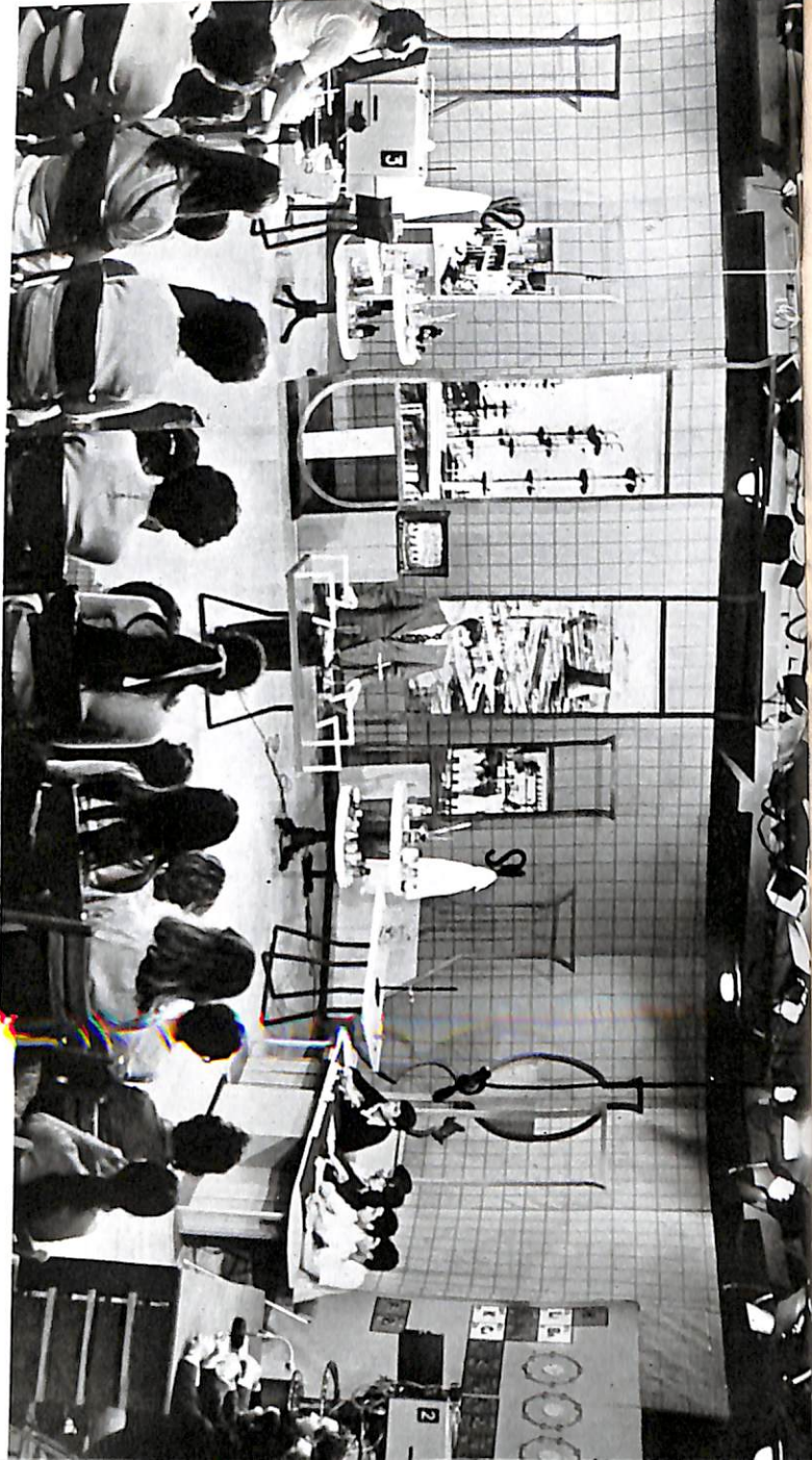
Gjatë punës në një nga studiot e Televizionit.