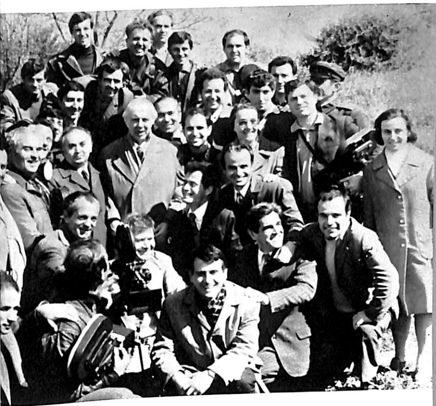
Shoku Enver Hoxha midis një grupi punonjësish të shtypit, të Radiotelevizionit e të Kinostudios.