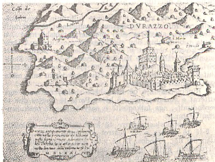
1. Durrësi, viti 1571, sipas një gravure të atlasit të Kamocios (Camozius)

rrethuese u reduktua në një katërkëndësh të thjeshtë me një perimetër fare të vogël. Për ndërtimin e këtyre mureve turqve osmanë u shërbyen si lëndë e parë monumentet e shumta antike të qytetit. Edhe sot një sy i kujdesshëm do të dallojë mjaft fragmente arkitektonike, kolonash, kapitelesh dhe mbishkrimesh të murosuras, fragmente të një ore diellore, të një stele të Hermesit; të një pllake të gdhendur me lule, të një frizi dhe stele të një luftëtari. (Megjithëse gjatë shekujve janë hequr nga arkeologë dhe grabitës profesionistë me dhjetëra objekte të tjera me vlerë, që sot gjenden nëpër muze të huaja).