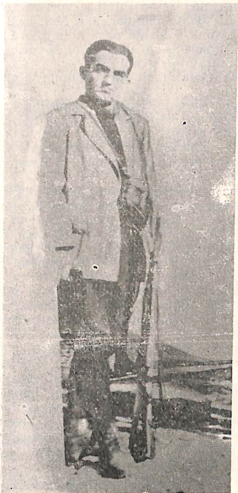
Memo Meto partizan.