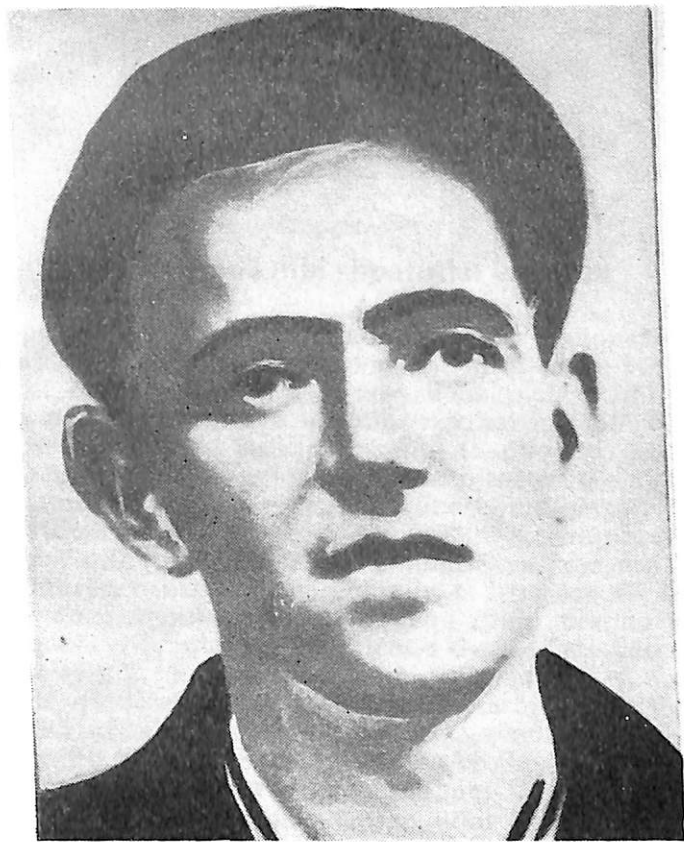
Heroi Popullit MYSLYM SHYRI