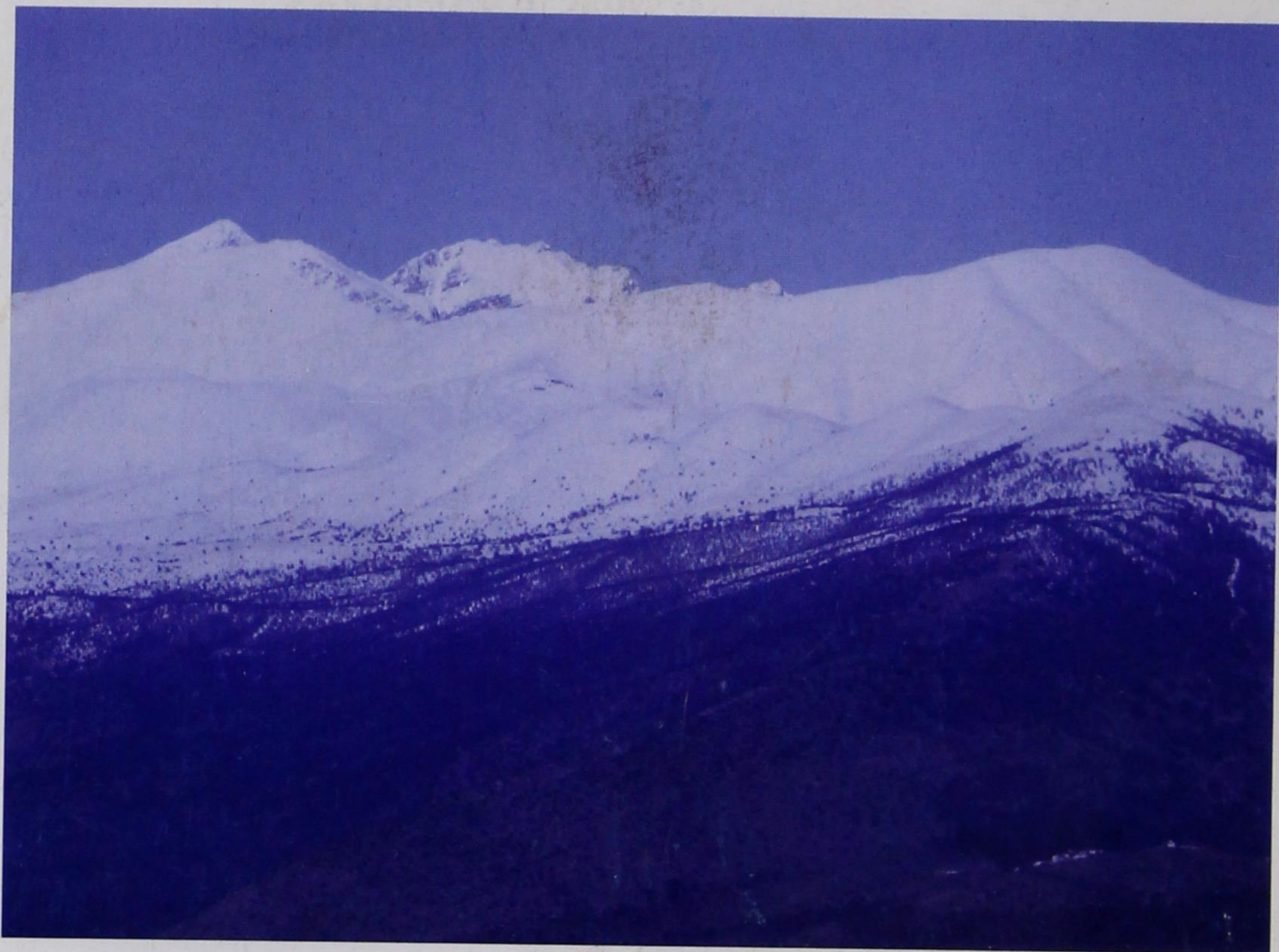
Η Νεμέρτσικα, άποψη από ανατολικά.

ΥΠΟΔ.1031 ΚΑΥ.25.90.09.0010 ΕΠΙΣΤΡΟΦΗ / RETOUR