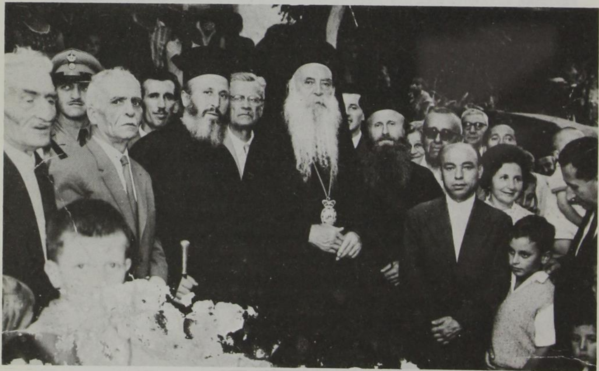
Ἀπό τὴν ἐπίσκεψι τοῦ Πατριάρχου Ἀθηναγόρα στό Πωγώνι στίς 23.7.1963.