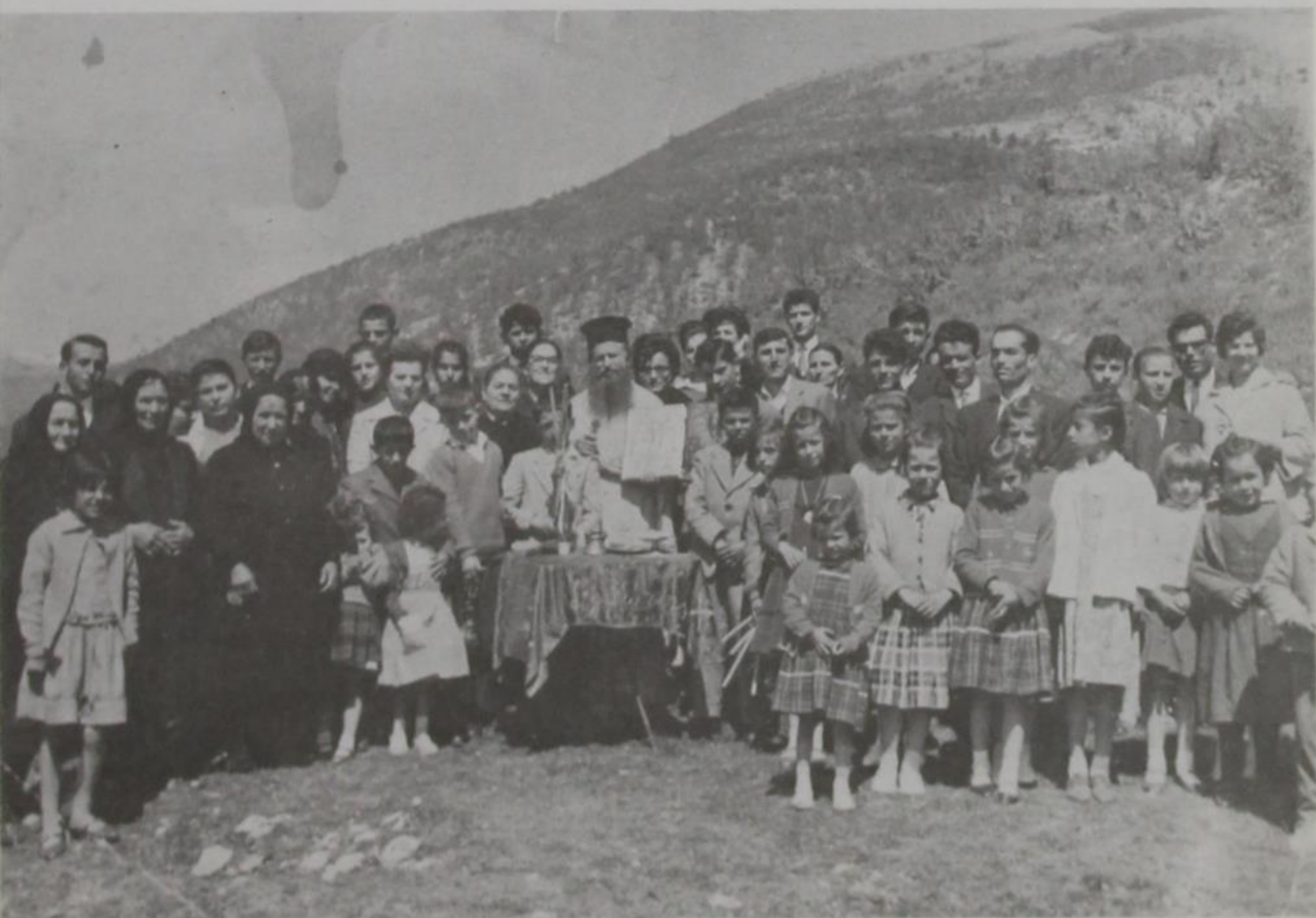
Πανηγύρι στό ἐξωκλήσι, Ἁγιοὶ Ἀνάργυροι, στούς Ποντικάτες τοῦ Πωγωνίου. Ἁγιασμός μετὰ τῆς θείας λειτουργίας.

Μετὰ τό δίσκο παλαιότερα, καί τώρα, χόρευαν ὅλοι μαζί μέ μουσικά ὄργανα (βιολιά). Τοῦτο γίνεται μέχρι τέλους τοῦ πανηγυριοῦ, πού κρατεῖ μιά, δυό, ἢ καί τρεῖς ἡμέρες καί συνεχιζόταν καί τό φαγοπότι. Αὐτά γίνονταν παλαιότερα.