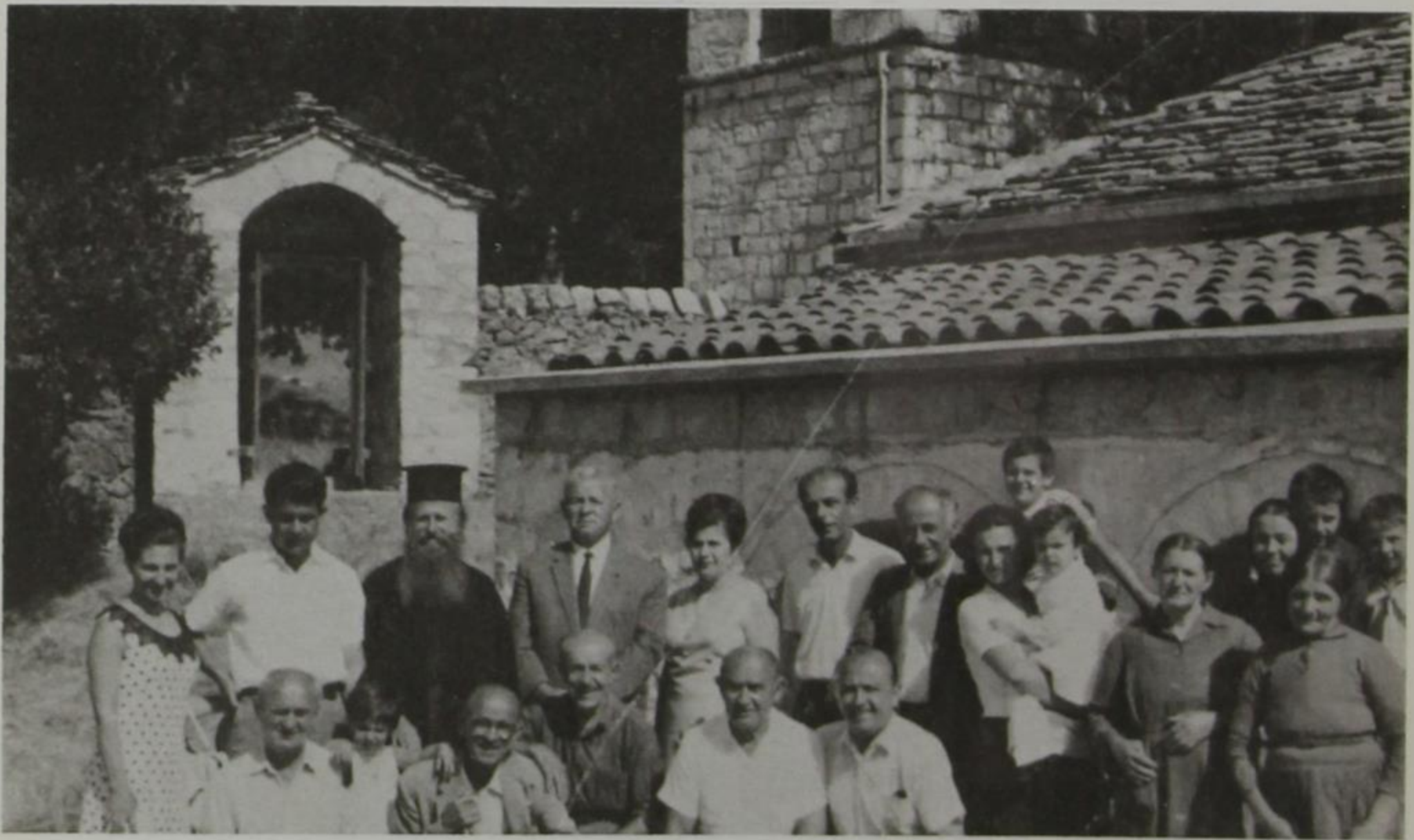
Μιά συντροφιά στό πανηγύρι τῶν Γενεθλίων τῆς Θεοτόκου στόν Ξηρόβαλτο Πωγωνίου (8.9.69).

Στό τέλος τοῦ φαγητοῦ οἱ πρόκριτοι τοῦ χωριοῦ ἔβγαζαν δίσκο (ὅπως καί τώρα) καί ὁ καθένας ἔριχνε χρήματα ἢ ἔκανε τάμα σέ εἶδος, (σιτάρι, καλαμπόκι κατά βούληση), καί τά χρήματα πού μάζευαν, καί τά προϊόντα ἦσαν γιά κοινούς σκοπούς.