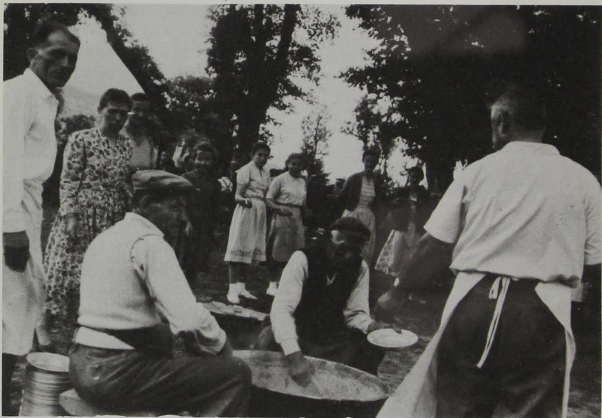
Διανομή «κοφτοῦ» στό πανηγύρι τῆς Δημόκορης Πωγωνίου.

Χόρευαν παλιά τούς στρωτούς χορούς κυκλικά, μπροστά οἱ ἄντρες καί στό τέλος οἱ γυναῖκες, συγκρατημένοι μπράτσο μέ μπράτσο.