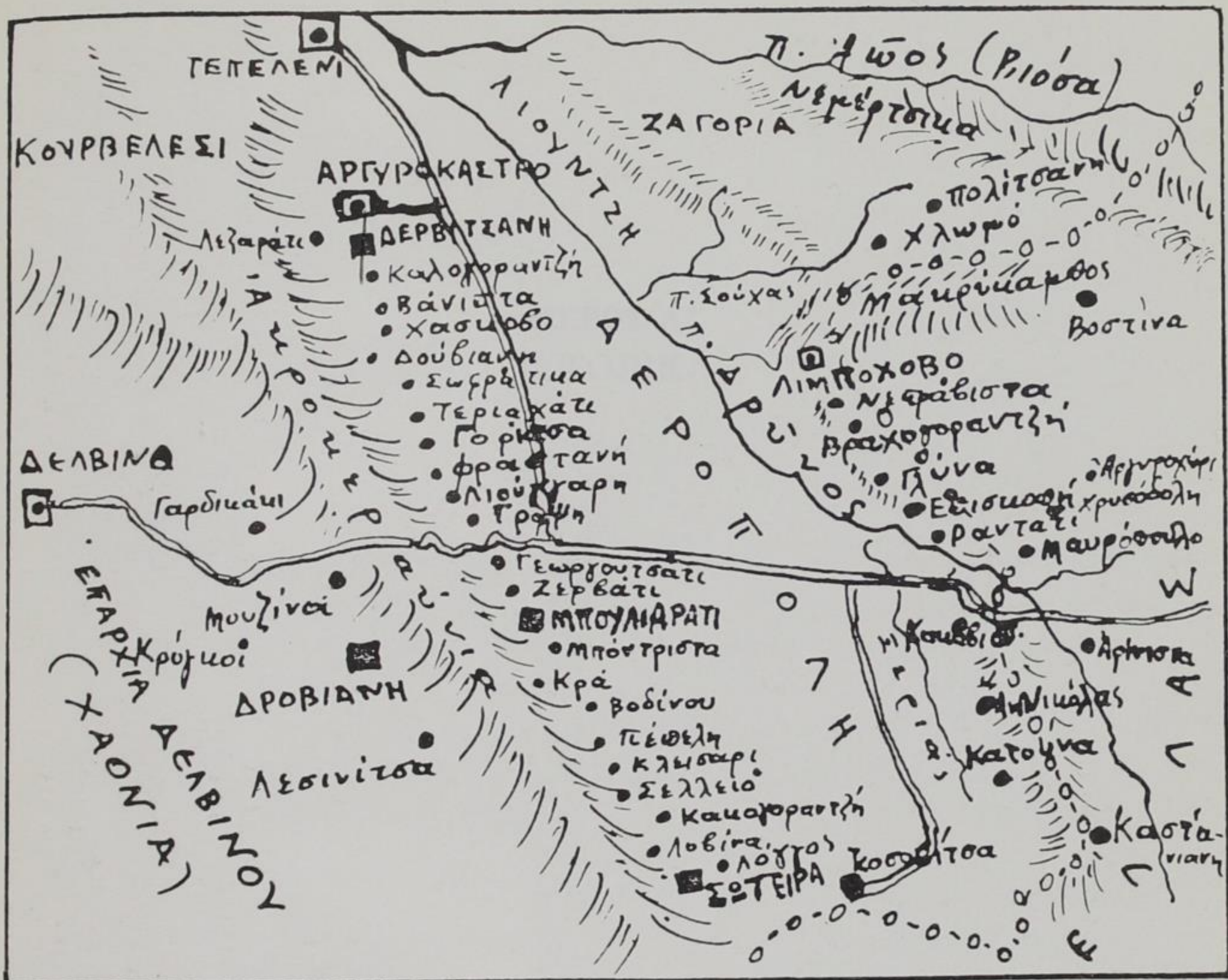
Τό χάρτη αυτό τόν πήραμε από τό βιβλίο τῶν Γεωργίου καί Χρήστου Γ. Καλυβόπουλου ΜΠΟΥΛΙΑΡΑΤΙ-ΔΕΡΟΠΟΛΗ.