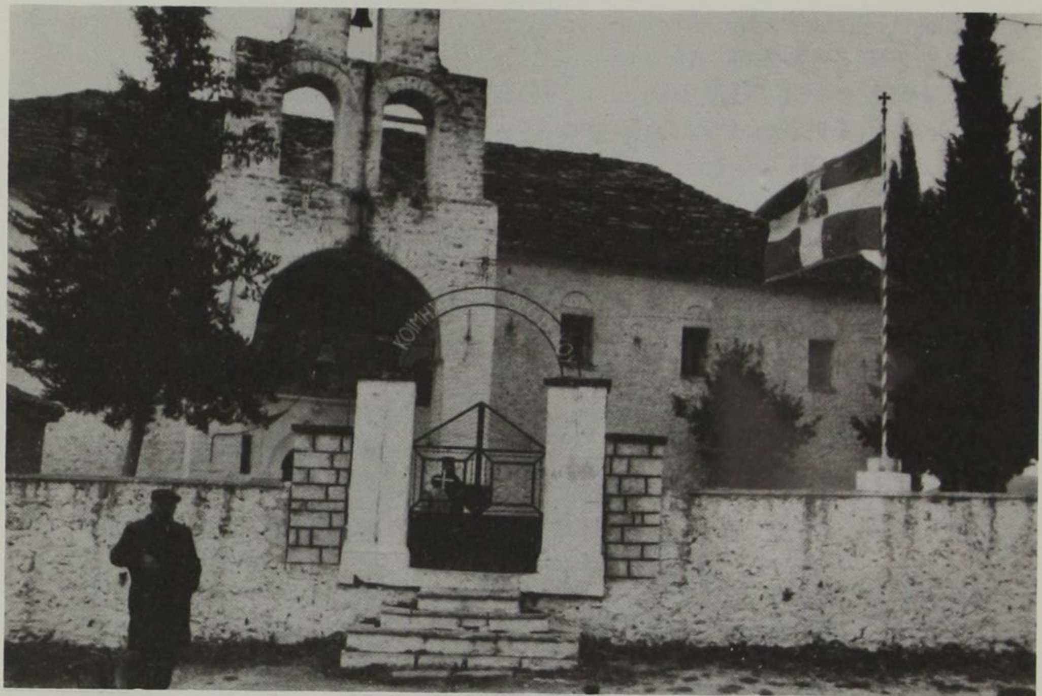
Κεντρικός ναός Κτισμάτων. Ἡ Κοίμησις τῆς Θεοτόκου.