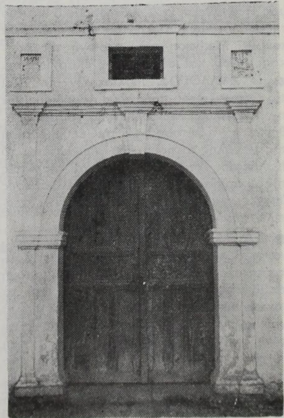
Στὴν Κόνιτσα. Εἴσοδος σπιτιοῦ Τζενέλ - μπέη (παλιὸ Γυμνάσιο)

Πάντως, ἄλλο ντεσκερέ δὲ θὰ σᾶς στείλουμε.