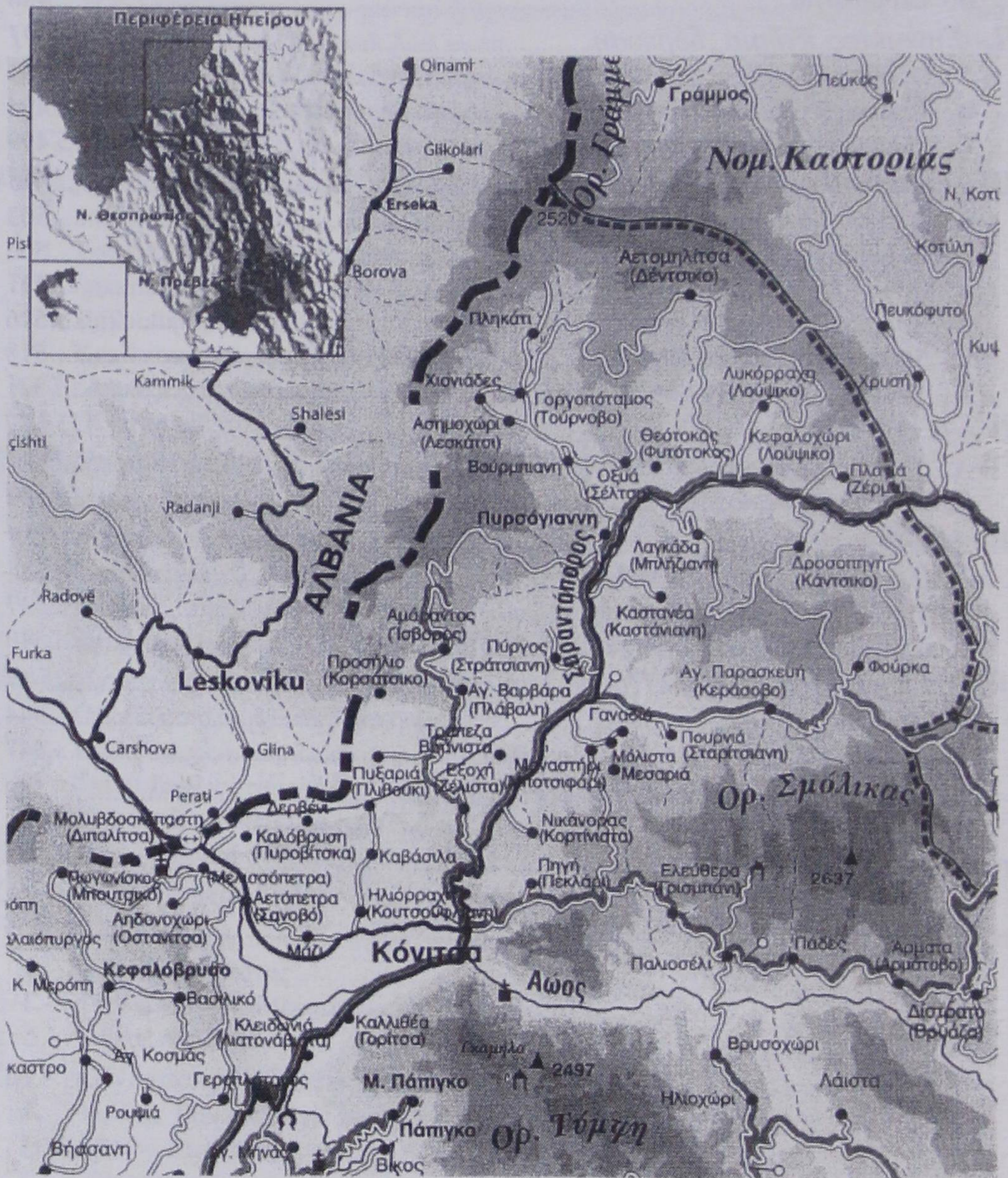
Χάρτης τῆς σημερινῆς ἐπαρχίας Κόνιτσας (σέ παρενθέσεις τὰ παλιὰ οἰκονόμια)

Ἀπό τό βιβλίο: Θ. Ζιώγας, Τά θολογυριστά πετρογέφυρα, 2017