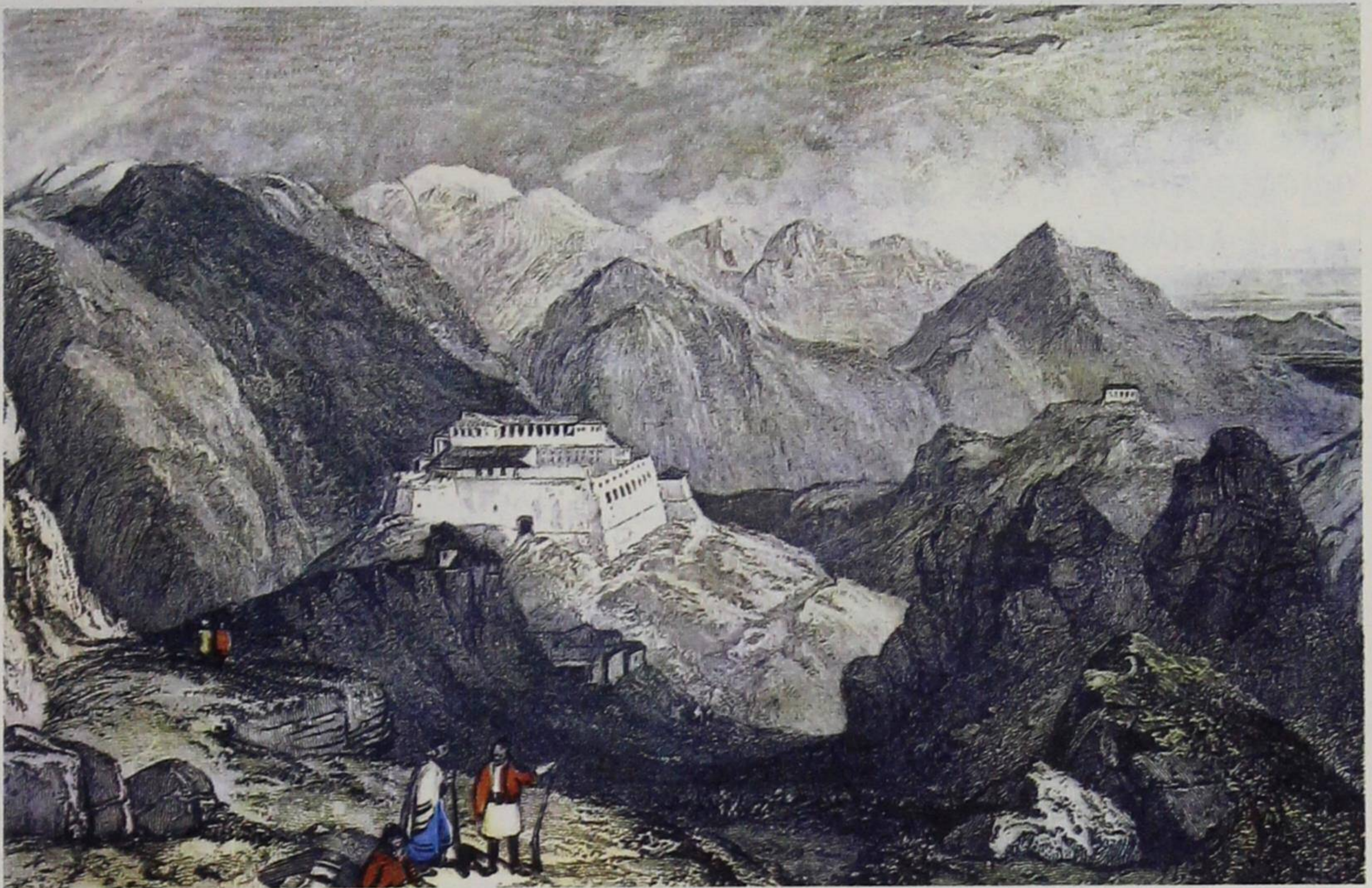
Το κάστρο της Κιάφας Σουλίου. Σχέδιο Η. Holland.

Όσο απλώνονταν η Οθωμανική Αυτοκρατορία τόσο αδυνατούσε η Πύλη να στέλνει παντού στρατεύματα για τάξη και ηρεμία. Οι τοπάρχες