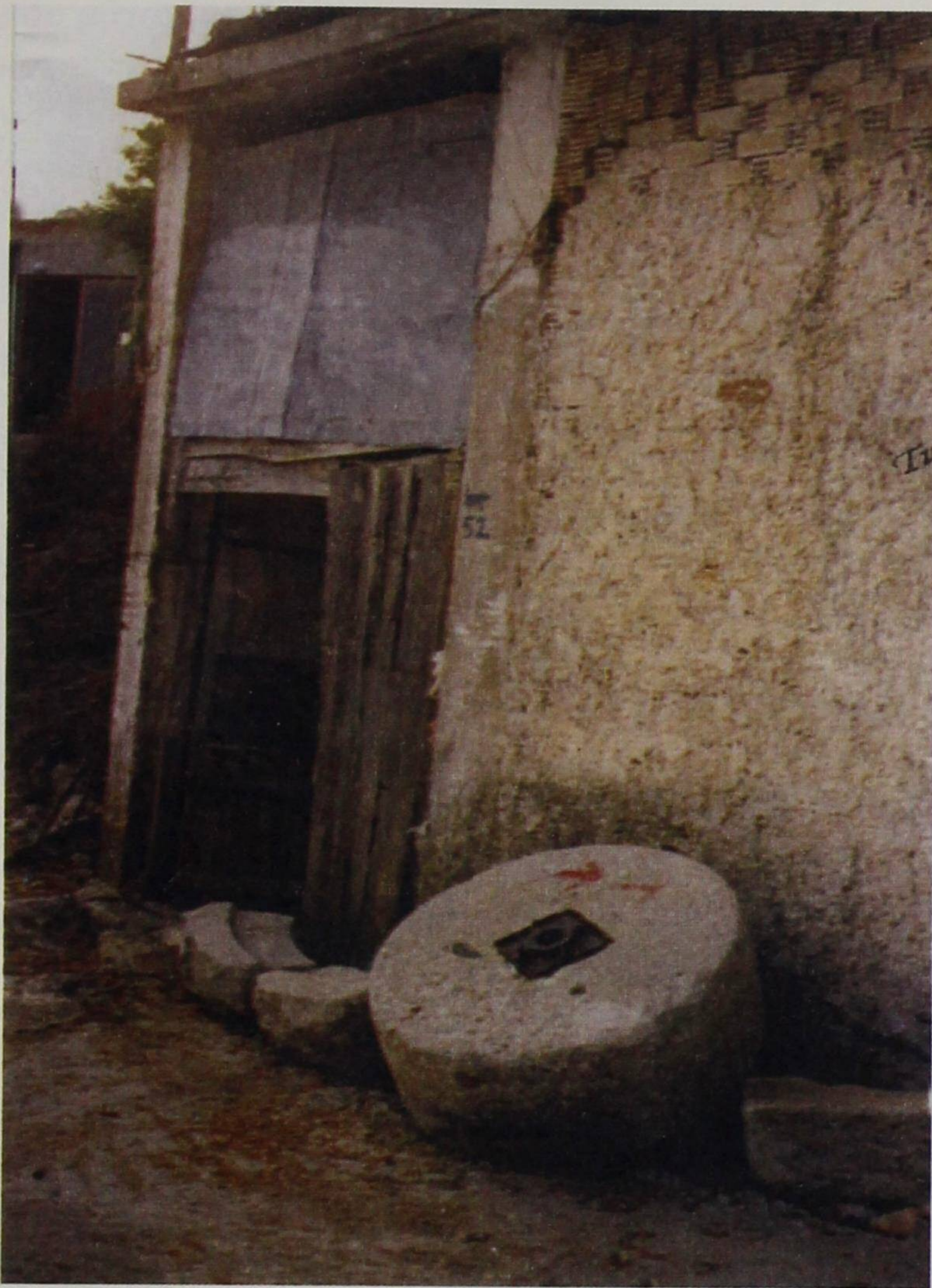
Ότι έμεινε από έναν αλευρόμυλο.

τους έλεγε σιωπάτε, άχνα μη βγάλετε. Γνώριζαν τα παιδιά από γιουρούσια, ήξεραν όμως και πότε να σφαλούν το στόμα τους και να υπομένουν στον πόνο όσο βαδύς κι αν ήταν.