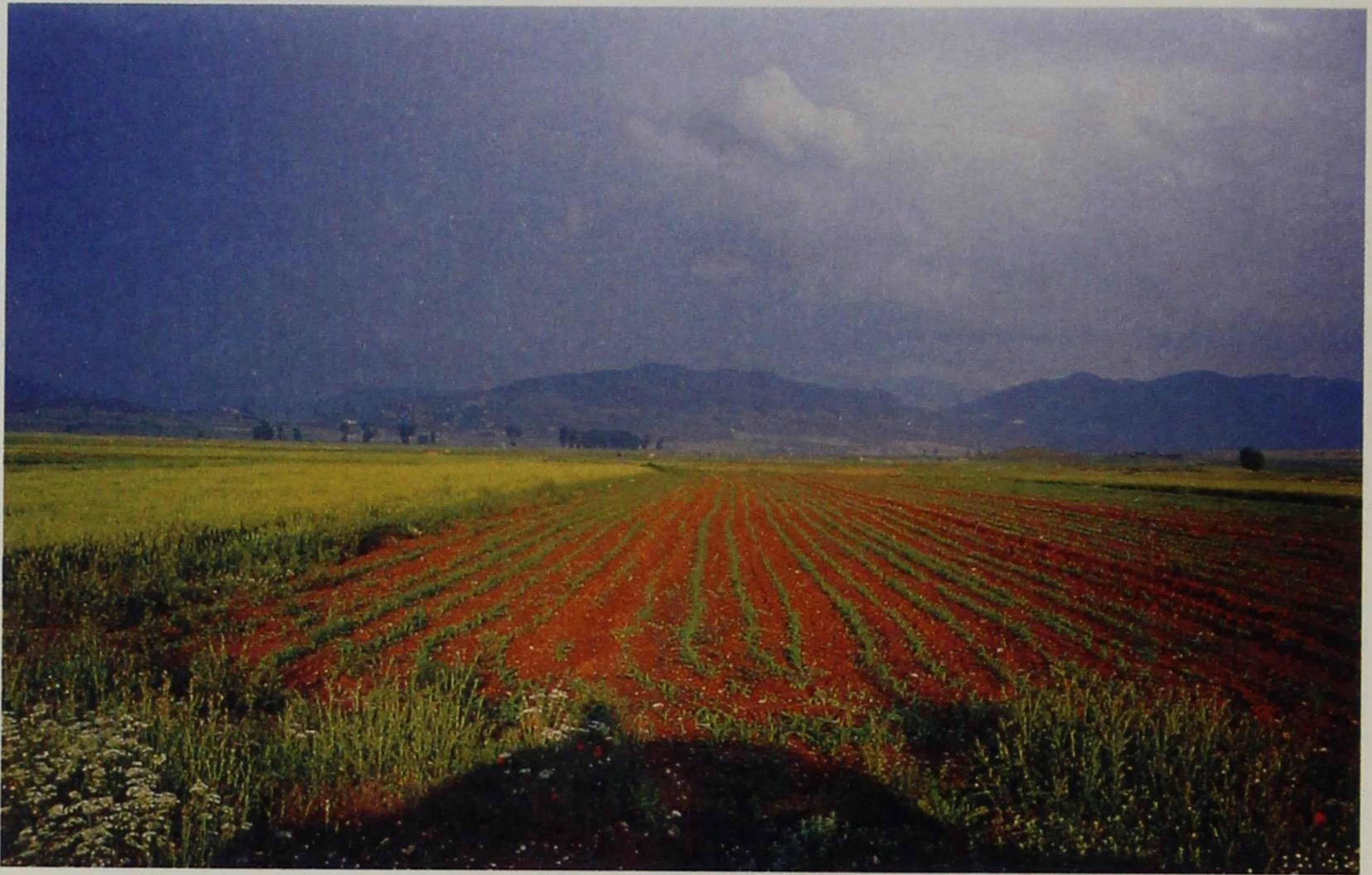
Ο κάμπος της Δερρόπολης το 1989.