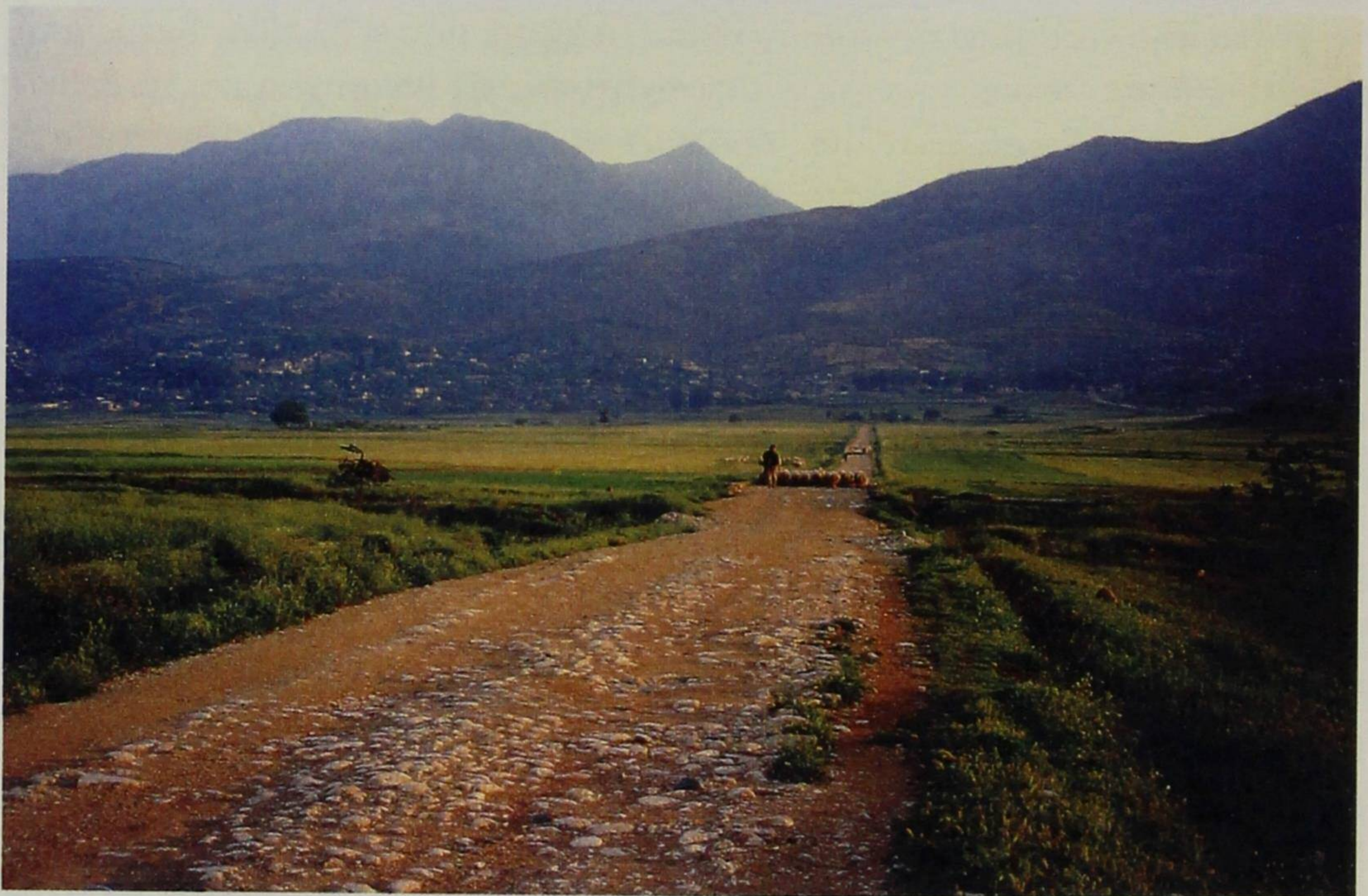
Ο κάμπος της Δερρόπολης το 1989, στις πλαγιές η Γλύνα.