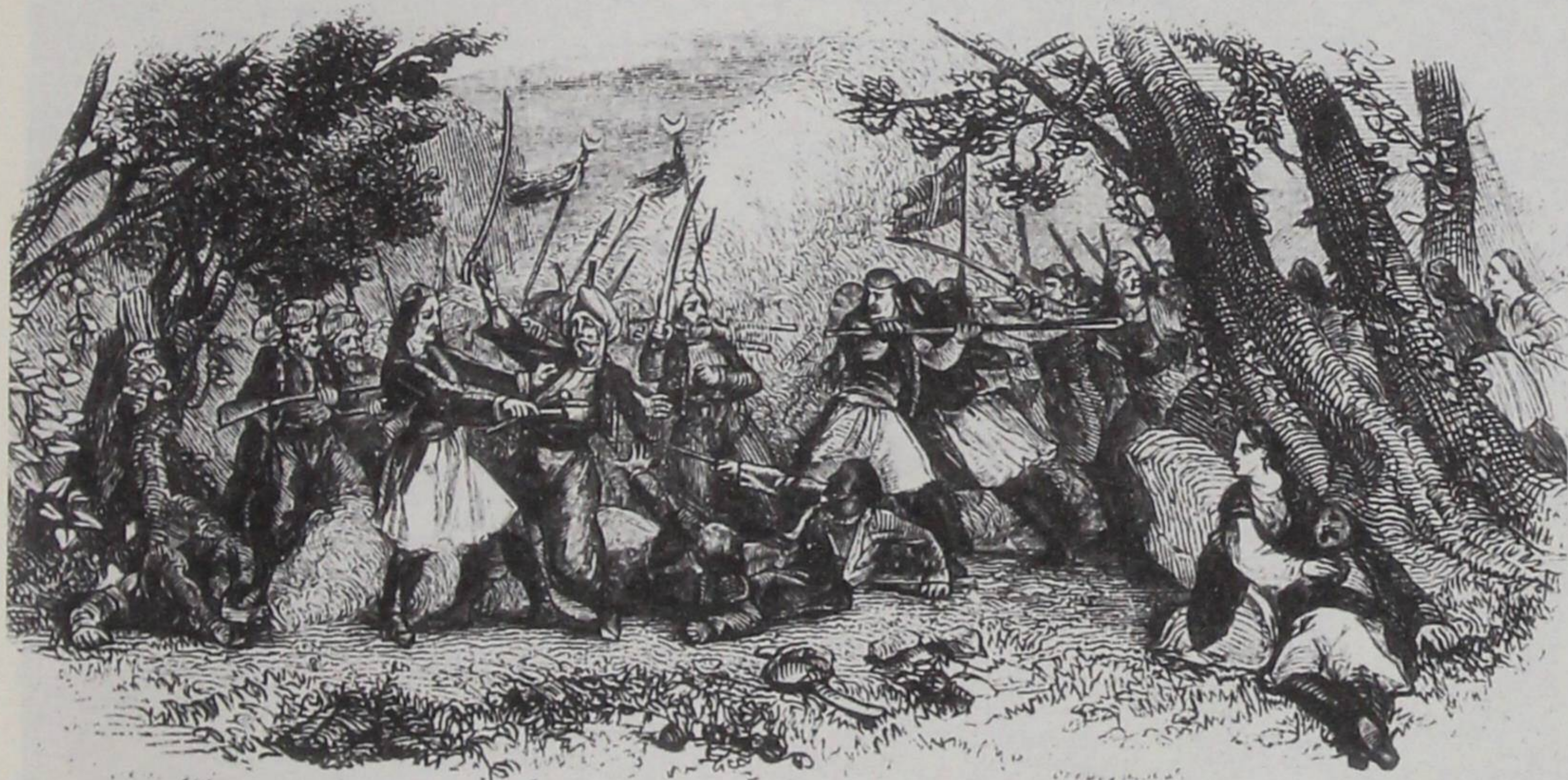
Σουλιώτες μαχόμενοι με Αρβανίτες: έργο του Sergent

Το χάλασμα του Γιώργου Νίκα έγινε το 1792. Στρατεύματα από το Τεπελένι κι άλλα πασαλίκια έπιασαν τις πλαγιές της Σέλιανης, έξω από την Παραμυδιά. Γέροι και γυναικόπαιδα ταμπουρώθηκαν στο χωριό. Οι άλλοι τραβήχτηκαν στον αυχένα κοντά στη Φανερωμένη, πάνω από τη σκάλα της Παραμυδιάς. Μιλιούνια οι Τουρκαλβανοί αιφνιδίασαν τα καρπούλια, ξέκαναν τα καρτέρια, κύκλωσαν τους τραυματισμένους που κρατούσαν το σκάλωμα. Εκατοντάδες οι σκοτωμένοι από τη μεριά των Τούρκων, όμως και οι Σουλιώτες πολλούς έχασαν.