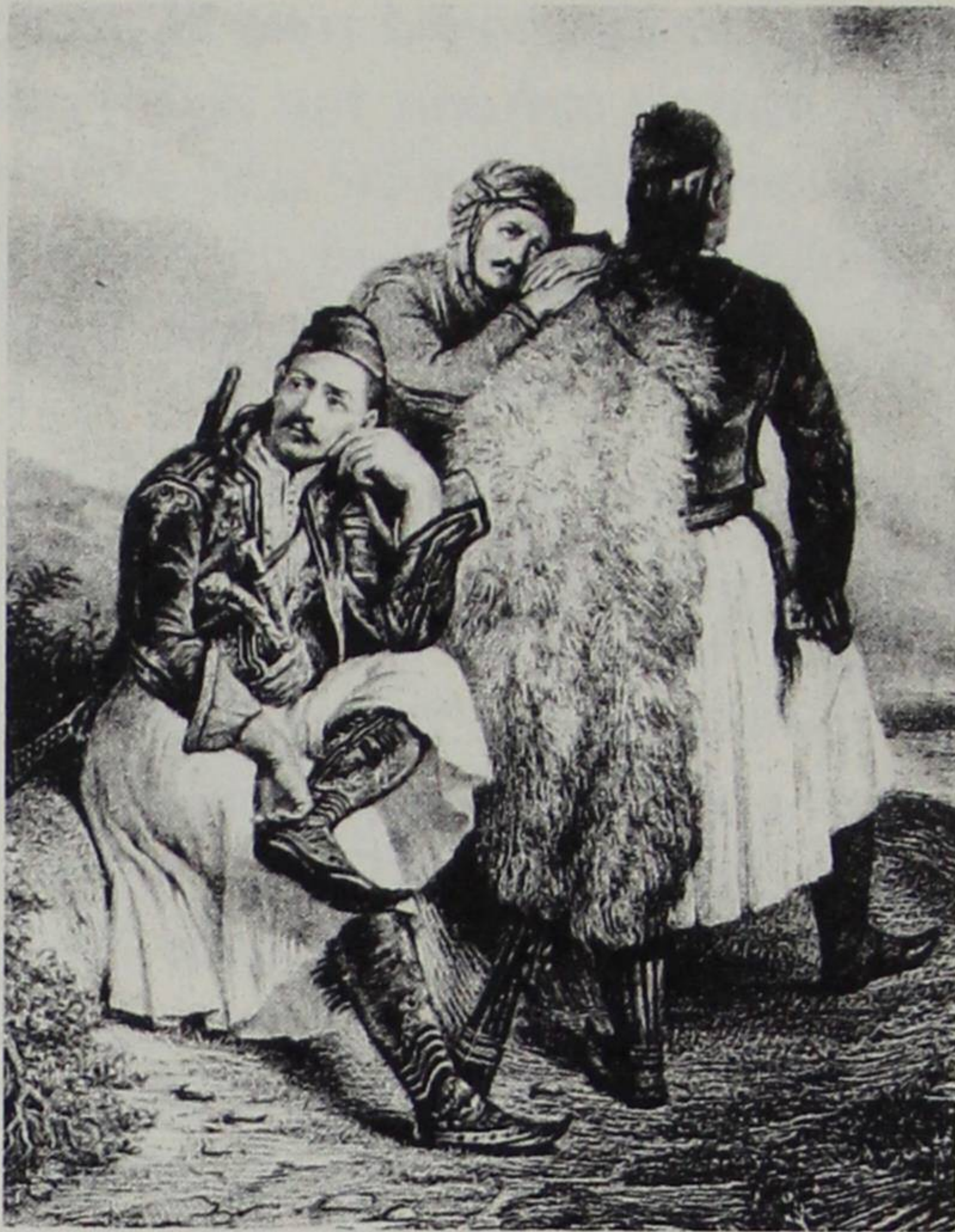
Αρματολοί θλιμμένοι απ' την απώλεια κάποιου συντρόφου.