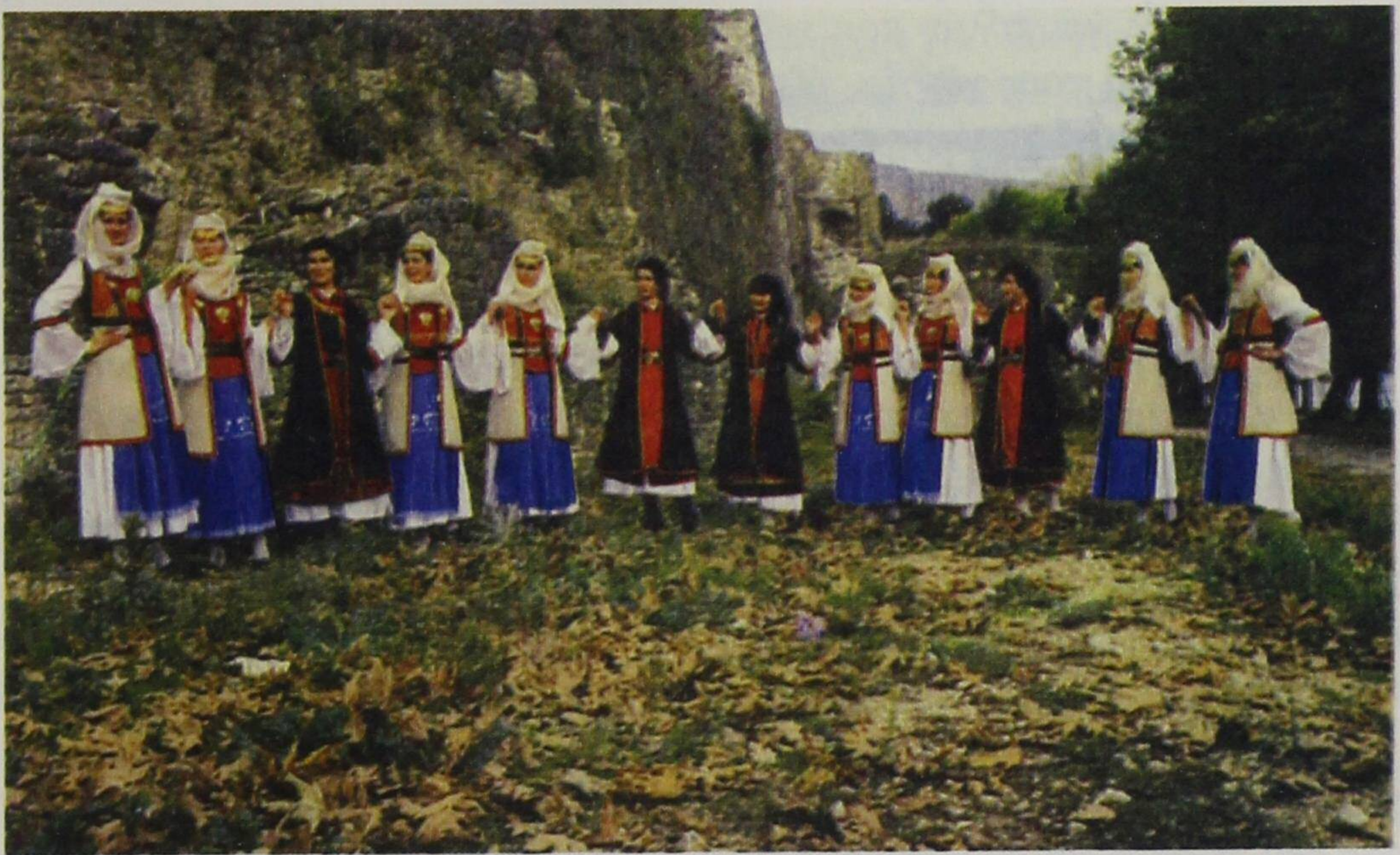
Χορευτικός όμιλος του Ιδρύματος Βορειοηπειρωτικών Ερευνών με παραδοσιακές βορειοηπειρωτικές ενδυμασίες.

Μεγάλος ο ανταγωνισμός μεταξύ των γυναικών για το ποια θα επιδείξει τα ομορφότερα υφάντά, ποια θα παρουσιάσει τα πιο φανταχτερά κεντήματα. Ο αργαλειός δεν έλειπε από το νοικοκυριό. Άλλα τα ρούχα της δουλειάς, άλλα τα γιορτινά κι άλλα τα πανηγυρίσια και της παντρειάς. Χαιρόσouna να θωρείς τις γυναίκες πιασμένες χέρι - χέρι, πραγματικά τις θαύμαζες! Αποτελούσαν ένα φανταχτερό σύνολο, συμπληρώνοντας η μία την άλλη. Αγνά τα αισθήματα, απονήρευτα τα ανταμώματα, ομόνοια και