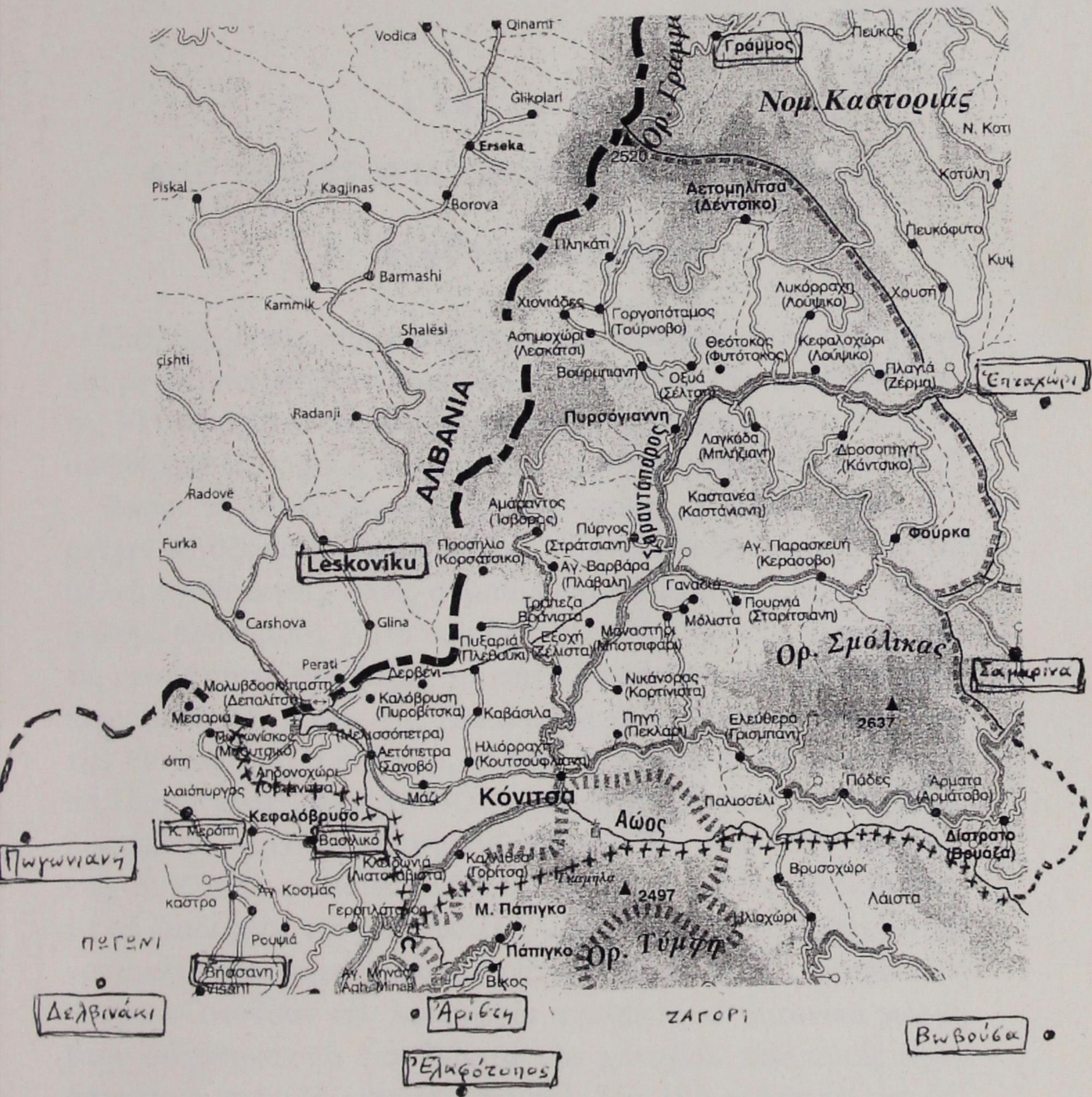
Η έπαρχία Κόνιτσας και τὰ 12 χωριά γύρω της